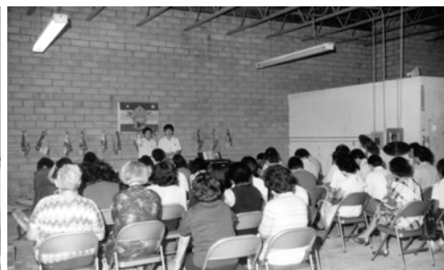
▲ 美國加百列教會人數增多，弟兄姊妹在工廠中聚會