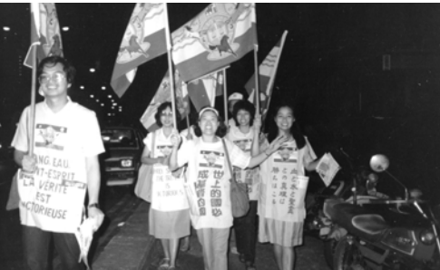
▲ 新加坡三巴旺支派高舉萬民大旗前進