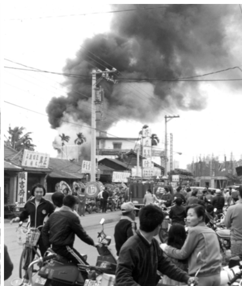
▲ 神印證勇士們的宣告，他們盡過職事的地方突然大火，警告這世代的百姓「逃生之路在於新約教會的神」