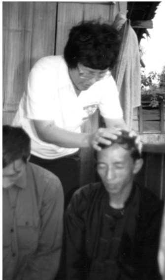
▲ 苗族百姓謙卑領受靈浸