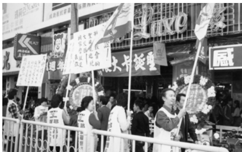
▲ 台中支派弟兄姊妹列隊前進