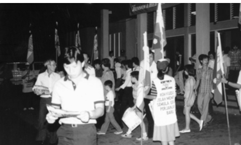
▲ 觀眾自體育場中湧出，許多人 被勇士們所盡的職事大大吸引