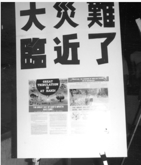
▲ 宣告「大災難臨近了」，並張貼彩色福音海報