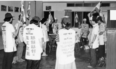
▲ 怡保支派出征前在會所中 一同舉旗禱告