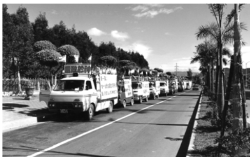
▲ 北部眾支派威武的福音車隊