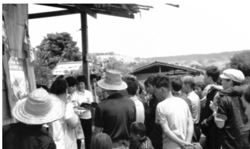
▲ 在狒篩村傳揚神主權的福音