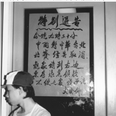
▲ 體育場貼出「中國對中華台北 比賽取消」的特別通知，其實 不是取消，而是一場絕無僅有 的不讓觀眾入場的比赛