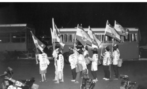
▲ 基督精兵勇往直前