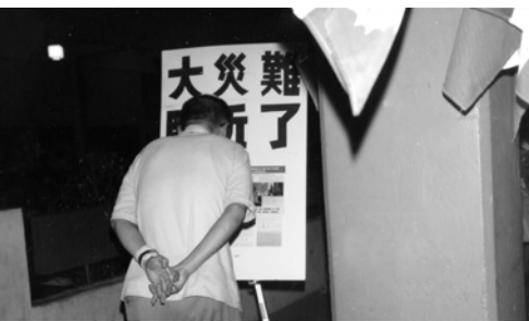
▲ 許多人被這些彩色海報所吸引，震動，驚奇神的作為