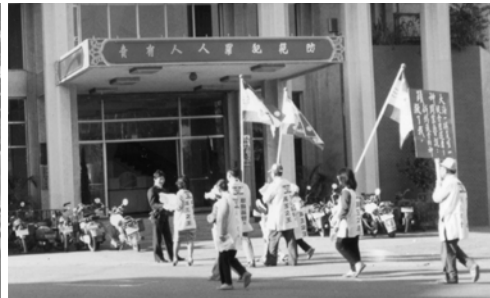
▲ 勇士們派發福音海報給警察