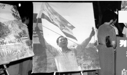
▲ 展示列國先知向列國豎立大旗的大型彩色海報