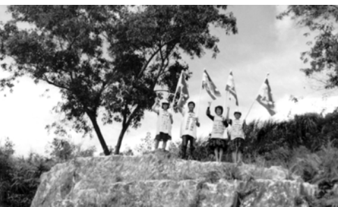
▲ 東馬美里支派在山頂豎立萬民大旗