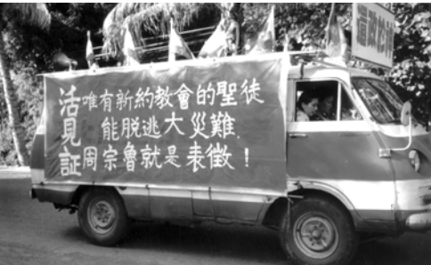
▲ 岡山、台南支派福音車隊浩浩蕩蕩地出發盡職事