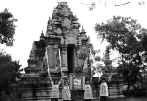
▲ 泰國勇士們在人國的迫害中繼續前進，在各個偶像廟前展揚萬民大旗，打碎偶像的權勢