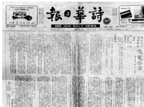
▲ 東馬古晉教會、詩巫教會在「詩華日報」上刊登「鳴冤啟事」