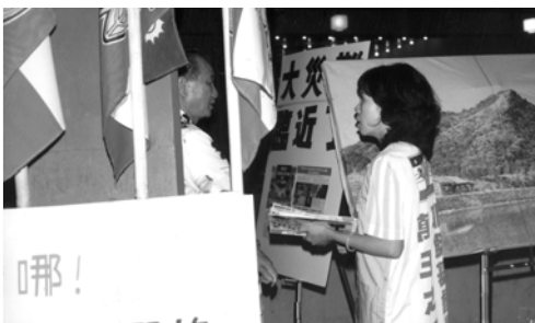
▲ 弟兄姊妹穿著福音軍裝派發福音海報