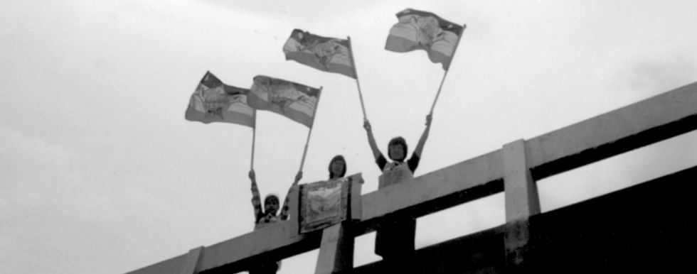
▲ 在盡職事途中，神以雙道彩虹向勇士們顯現，弟兄姊妹舉旗歡呼