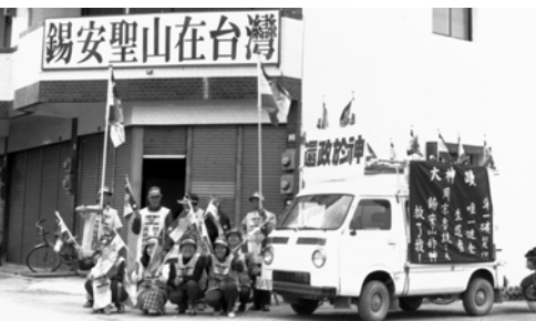
▲ 勇士們準備出征，向台東地區百姓報告「大神蹟」的好消息