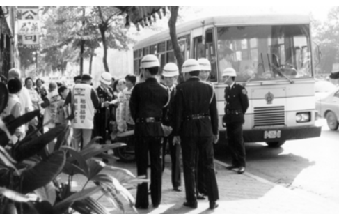
▲ 警察圍住福音車，弟兄姊妹大公而無畏，繼續前進