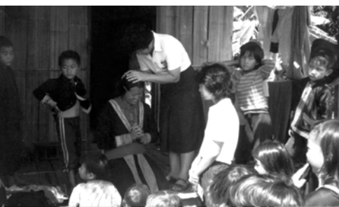
▲ 苗族姊妹歡喜地受靈浸