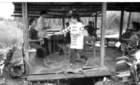
▲ 勇士們奮勇爭戰，釋放罪奴