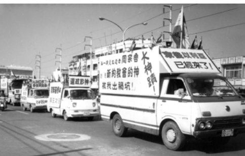
▲ 福音車隊向雲嘉一帶百姓見證新約教會的神行作的大神蹟