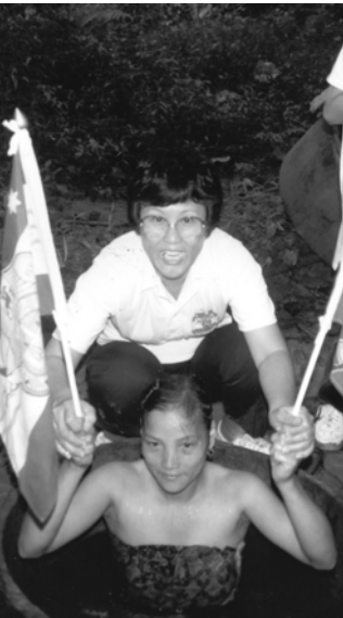
▲ 苗族百姓受水浸歸主名下