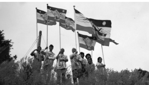
▲ 勇士們在南投縣水里鄉的山頂展揚大旗