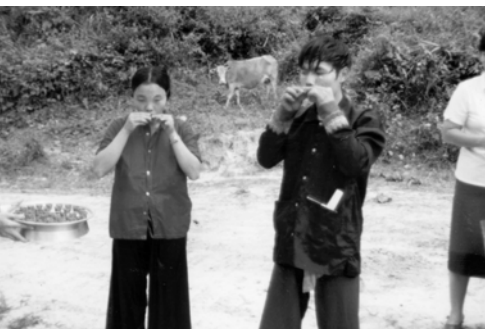
▲ 受水浸後一同擘餅記念主