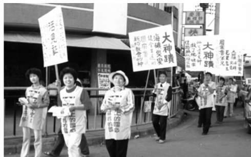
▲ 走遍大街小巷，傳揚大神蹟