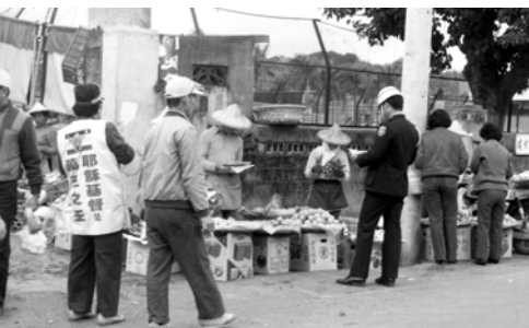
▲ 警察、老百姓都得知這大好消息