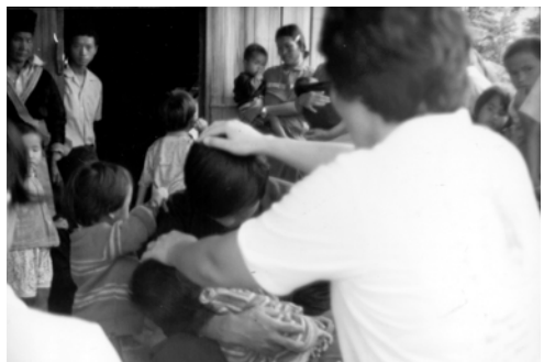
▲ 瓦差遊弟兄的兒子發熱病，吳姊妹按手禱告後立刻蒙神醫治