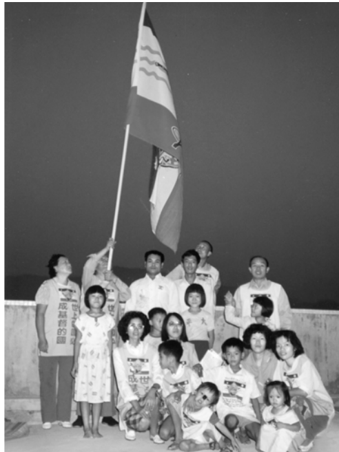
▲ 台中支派在台中縣太平鄉豎立大旗