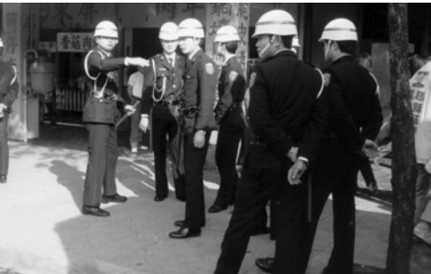
▲ 會所樓下劍拔弩張