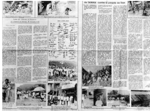
▲ 南太平洋大溪地教會也在當地的法文報上揭發台灣政府迫害新約教會的事實