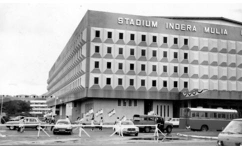
▲ 基督精兵來到體育場盡職事， 現場有許多警察及鎮暴部隊