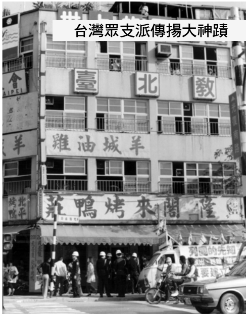
台灣眾支派傳揚大神蹟