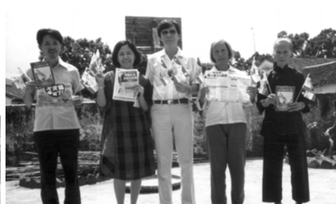
▲ 大洋洲聖徒到中國廣東探親時，將福音海報傳給當地百姓