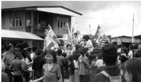
▲ 瓦朱弟兄繙譯苗語向歸樓村的百姓宣告福音