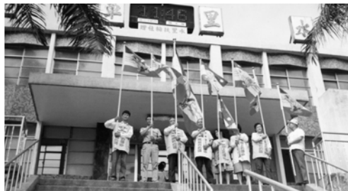
▲ 基督精兵在水里車站前展揚萬民大旗