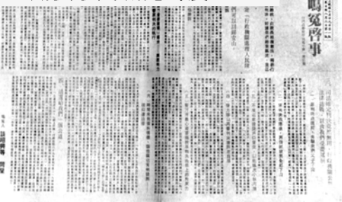
▲ 西馬聖徒在「星檳日報」上轉登台灣自立晚報及民眾日報上的「錫安子民談昭興等鳴冤啟事」