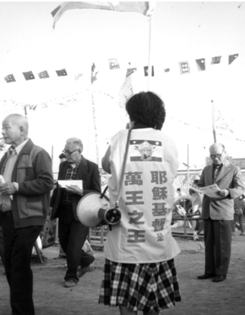
▲ 弟兄姊妹在鬧區盡職事，宣告新約教會的神行作了大事