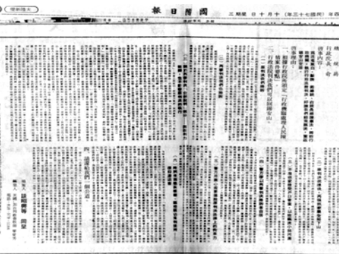
▲ 加百列教會在美洲「國際日報」上照樣刊登「鳴冤啟事」