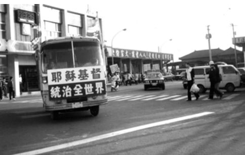
▲ 警車尾隨在我們的福音車後