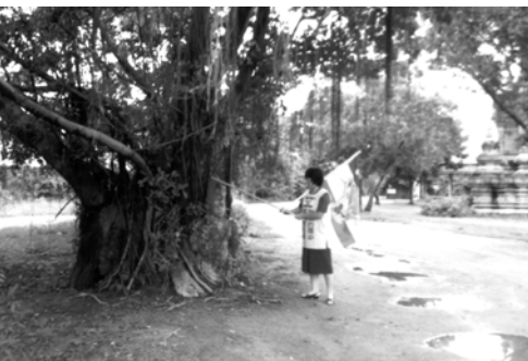
▲ 吳姊妹舉起錫安能力的杖打碎大榕樹下的印度偶像