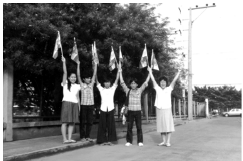
▲ 瓦朱弟兄、瓦磋弟兄來到曼谷接受真道造就，靈裡滿了喜樂