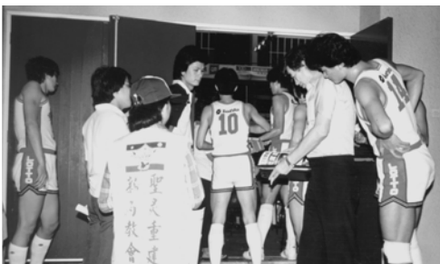
▲ 勇士們把「廿世紀大冤案」， 派發給中華隊的職員和球員們