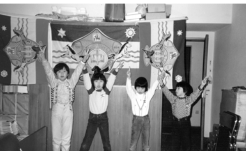
▲ 德國科隆支派弟兄姊妹日益增多，孩子們歡唱「錫安頌」