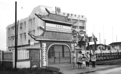
▲ 美里支派勇士們高舉萬民大旗準備出征