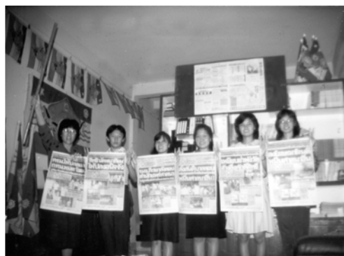
▲ 泰國見證人為神應驗先知所說「新約教會的事要以頭條新聞被刊登在報上」的話而歡呼