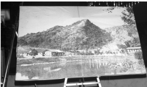
▲ 展示錫安山大型彩色海報，見證聖山在台灣