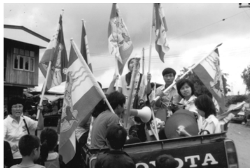
▲ 在苗族的歸樓村，勇士們揚旗盡職事