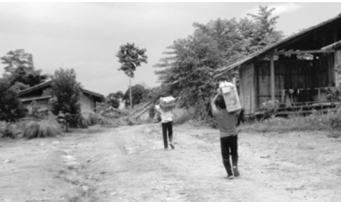
▲ 瓦努弟兄、瓦碰弟兄扛著福音海報一同前進