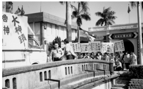
▲ 弟兄姊妹舉著「大神蹟」及「活見證」的看板向百姓們作見證