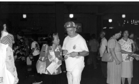
▲ 雅弗裔曼寧弟兄盡職事