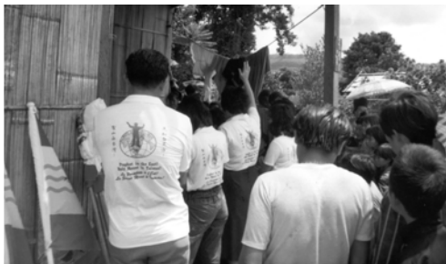
▲ 泰國支派與苗族弟兄姊妹一同聚會敬拜神