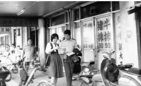
▲ 百姓欣然接受海報，得知逃生之路在新約教會的神