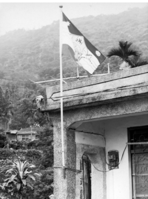
▲ 口社教會弟兄姊妹家中豎立萬民大旗，擺出基督得勝的榮耀見證