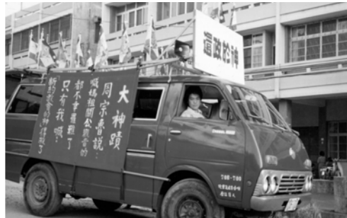
▲ 彰化支派福音車整裝待發