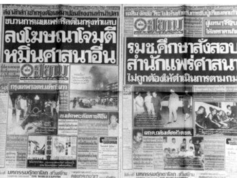
▲ 泰國見證人10月26日刊登兩大版的福音廣告後，在泰國引起強大的震撼，10月29~31日的泰文報上以頭條新聞報導新約教會的事