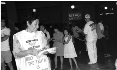
▲ 賽利洛姊妹盡職事