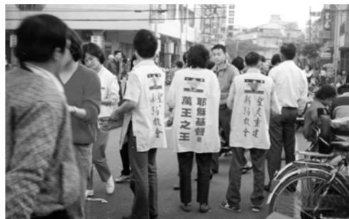
▲ 勇士們在人群中傳揚「大神蹟」