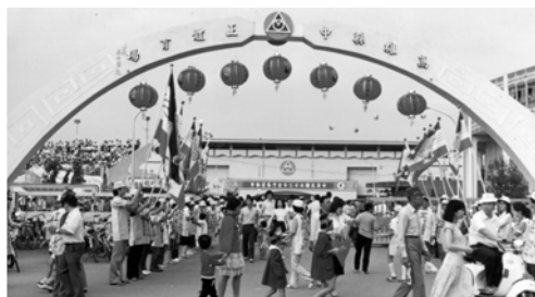
▲ 高雄、鳳山、小港弟兄姊妹在區運會場傳福音並展揚萬民大旗。呼招萬民一同進入錫安之門