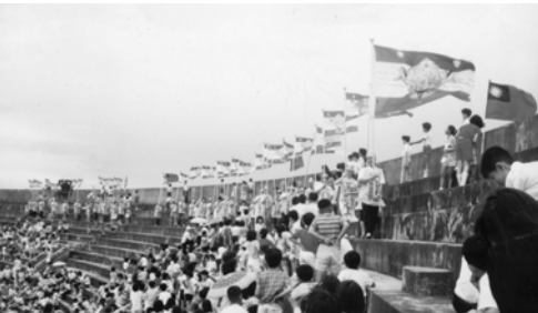
▲ 台中支派弟兄姊妹在區運會場傳福音並展揚萬民大旗