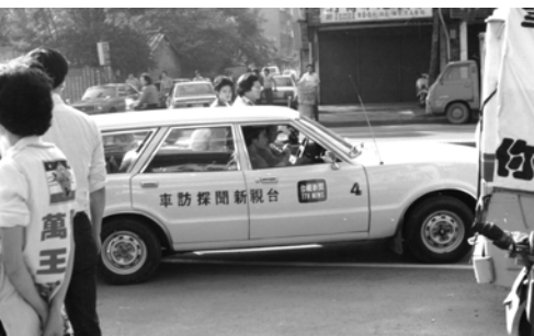
▲ 台視新聞採訪車也穿梭其間