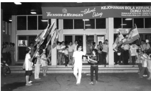
▲ 在體育場入口處勇士們舉旗 排列成錫安之門