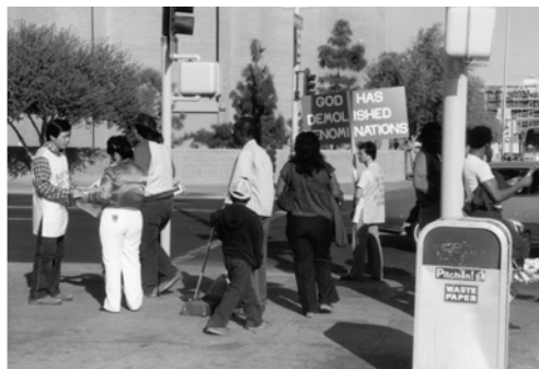
▲ 3月6日勇士們在鳳凰城盡職事