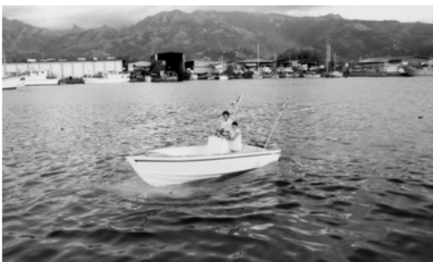
▲ 吉吉弟兄及姊妹駕著插著萬民大旗的快艇前來迎接勇士們