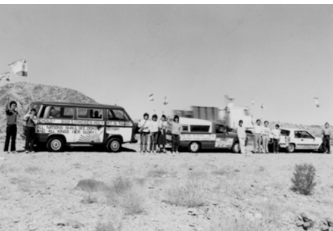
▲ 由洛杉磯往鳳凰城途中，弟兄姊妹在一淨光處豎立大旗