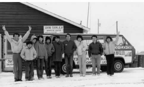
▲ 3月16日經過懷俄明州，有人問台瑞弟兄：「你是洪以利亞嗎？」