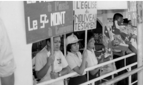
▲ 勇士們站在甲板上，高舉萬民大旗及福音看板