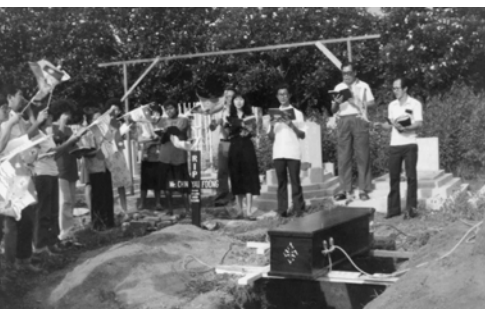
▲ 弟兄姊妹在墓地搖旗唱詩，歡送得勝者榮歸天家