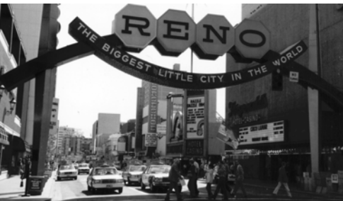
▲ 中午在賭城「雷諾」前豎立大旗盡職事