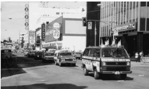
▲ 福音戰車圍繞耶利哥（雷諾），此處有許多賭場