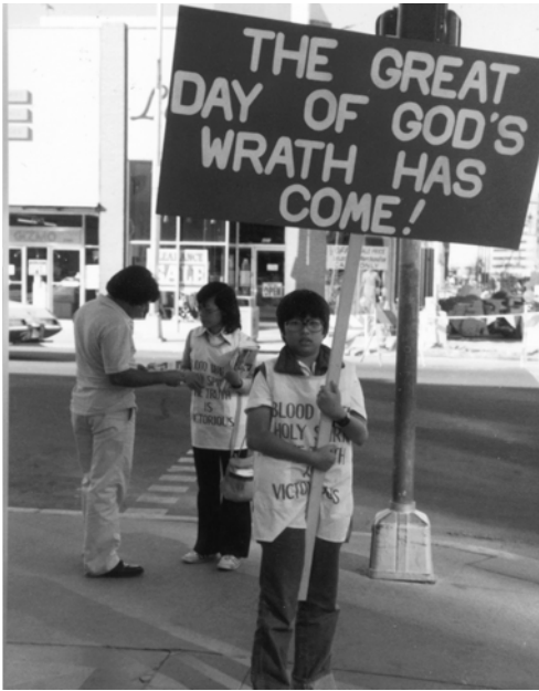
▲ 在新墨西哥州的阿布克其盡職事。夏威夷支派小威手舉福音看板