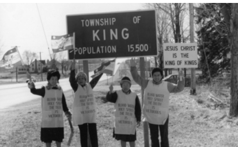
▲ 勇士們在安大略省各地豎立大旗，盡職事