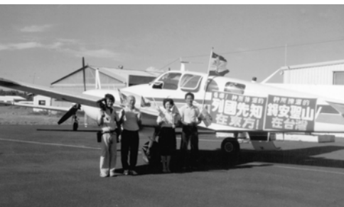
▲ 芝英姊妹及錄影的弟兄們乘坐小飛機向戰場前進，這是陸、海、空聯合作戰