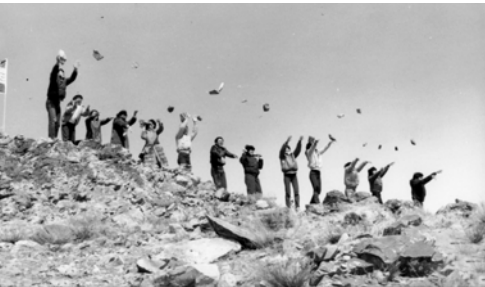
▲ 弟兄姊妹扔大石頭，預表在得勝的靈裡趕出世界的王