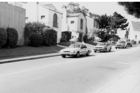
▲ 3月21日高舉萬民大旗往三藩市前進