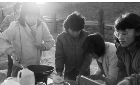
▲ 3月8日早上出發前姊妹們在營地準備早餐