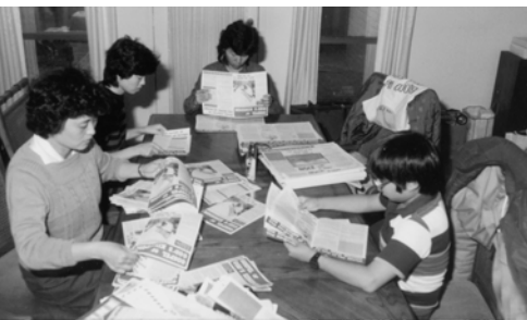
▲ 晚上到達休士頓教會，弟兄姊妹一同摺福音海報