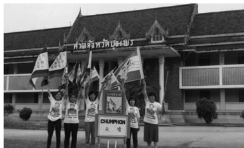
▲ 勇士們在也拉、馬中、哥洛、挪拉鐵吾、北大年、宗卡、博他隆、洛坤、素叻、尖噴等地吹角揚聲，拯救靈魂