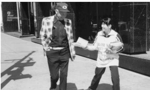
▲ 腓比姊妹派發福音海報