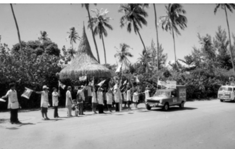
▲ 步兵隊與戰車隊會合