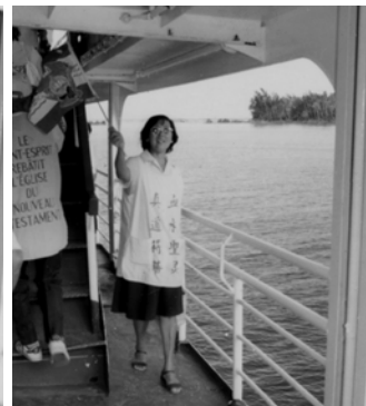
▲ 弟兄姊妹紛紛進入船艙