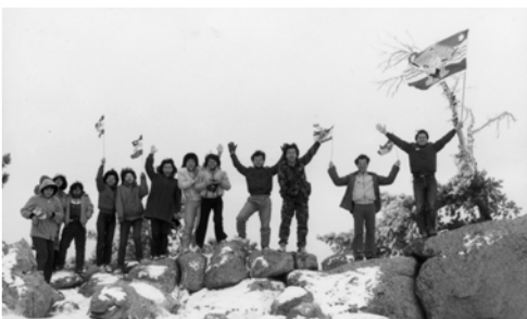
▲ 勇士們在雪地上豎立大旗