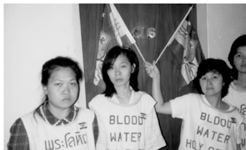
▲ 有次他們在旅店過夜，竟發現房間號碼為「416」。錫安山充滿天下！