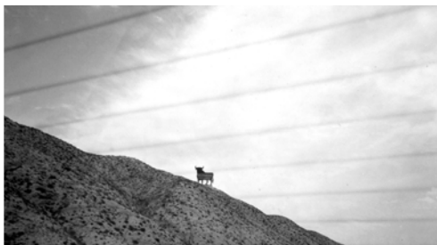
▲ 他們發現有座山頂上立了一隻黑色公牛，如看見巴珊大力的公牛