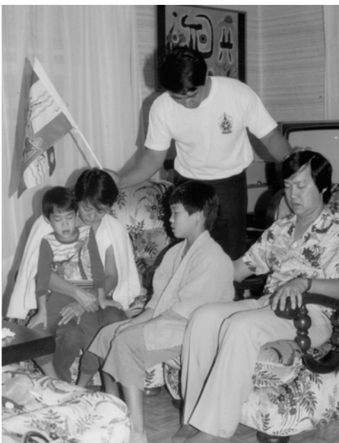
▲ 馬可弟兄一家得知真道後，接受靈浸