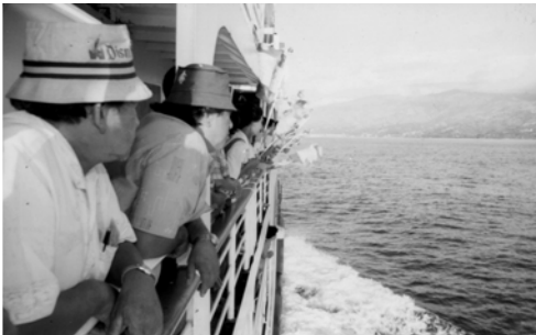
▲ 勇士們乘風破浪，得勝凱歸