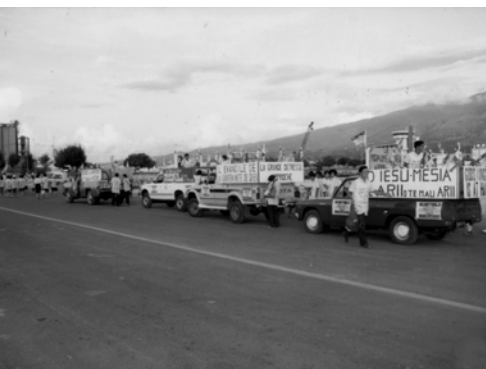
▲ 福音戰車在碼頭等候上船、過海