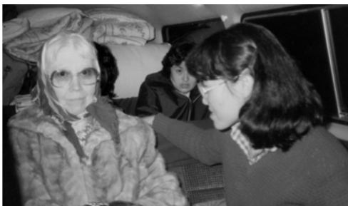
▲ 宗派的艾特那姊妹看見福音車上的宣告，前來尋求真道