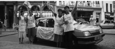
▲ 勇士們高舉萬民大旗收復比利時失土歸耶穌基督