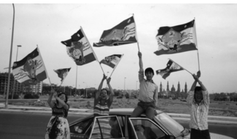
▲ 勇士們在西班牙展揚萬民大旗，收復失土歸耶和華為聖