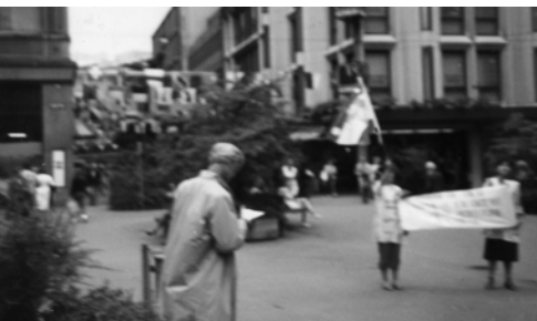
▲ 在瑞士、蘇黎克，勇士們向該地猶太人見證耶穌基督