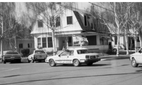
▲ 萬民大旗伸出車窗外，一路飄揚，何等威風！雄壯！