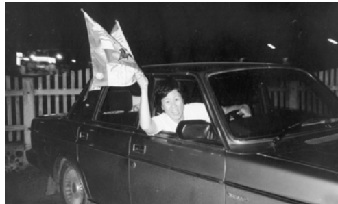
▲ 有時找不到旅店，就露天睡在福音車內，仍無畏環境的險惡