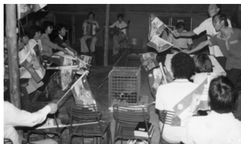
▲ 同工們一同對付希律那老狐狸的後裔