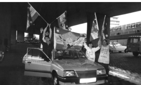
▲ 來到慕尼黑，豎立萬民大旗，揚聲招聚日耳曼民族進入錫安之門