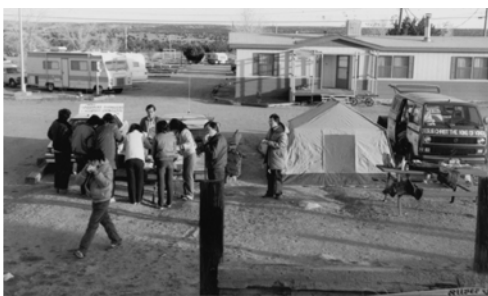
▲ 弟兄姊妹吃早餐準備出征