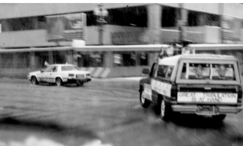
▲ 3月17日福音戰車圍繞耶利哥（鹽湖城）