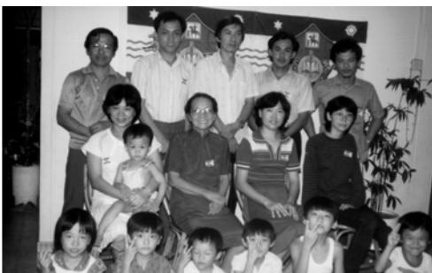
▲ 欣山的弟兄姊妹在主裡歡聚——之一