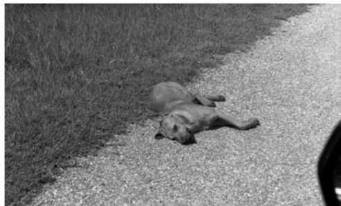
▲ 又看見好多狗被撞死。所有犬類惡黨都要慘死！