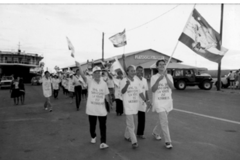
▲ 勇士們歡歡樂樂凱旋歸來