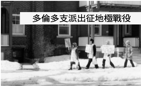
▲ 基督精兵高舉福音看板奮勇前進