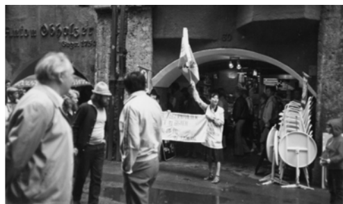
▲ 在奧地利宣告「先知在東方，聖山在台灣」，眾人深受震動