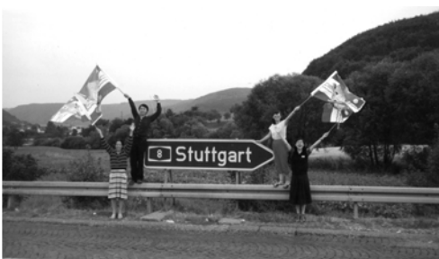
▲ 繼續前進，收復司徒加的失土