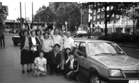
▲ 英、法、德的弟兄姊妹在福音戰車前合影