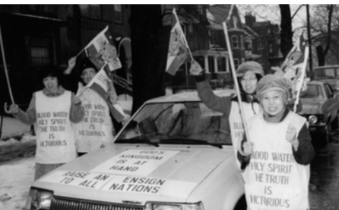
▲ 勇士們高舉萬民大旗及錫安能力的杖在雨中盡職事