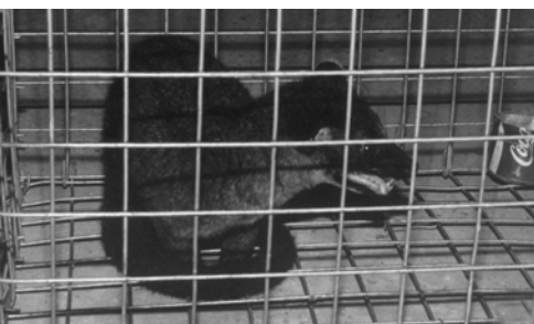
▲ 泗里奎弟兄姊妹不畏狐狸，狐狸就成為他們的擄物，7月17日被送到伯特利