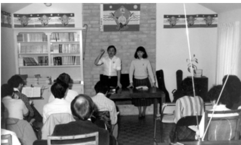
▲ 3月11日主日在休士頓教會聚會