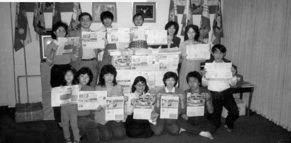
▲ 收到由台灣寄往美國的英文福音海報後，弟兄姊妹一同合影