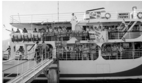
▲ 整艘船上都站滿了基督的精兵，福音戰艦向摩利亞島前進