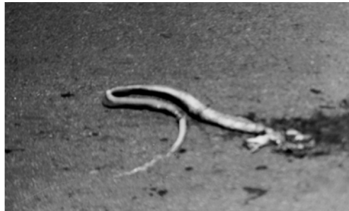
▲ 一路上看見好多蛇被壓死在馬路中。所有大龍古蛇都要如此滅亡！