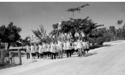
▲ 步兵隊高舉萬民大旗前進