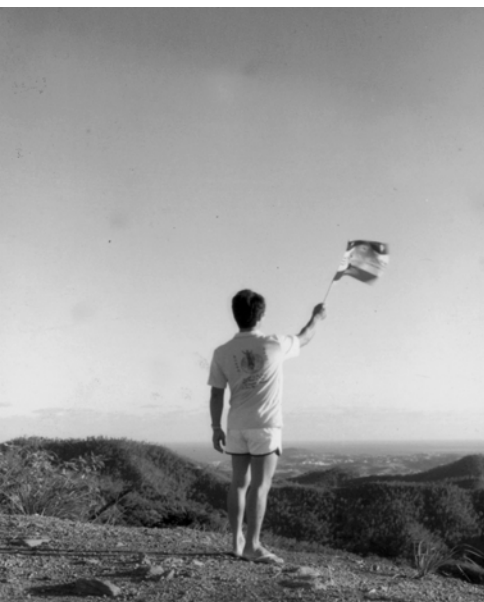
▲ 安德烈弟兄在新加利多尼島一處山上豎立大旗，招呼那地的百姓流歸錫安