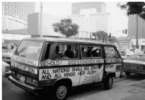
▲ 弟兄們在福音戰車上插上萬民大旗，佈置妥當