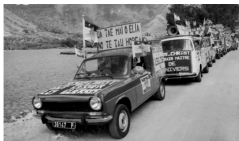
▲ 看哪！紅馬、白馬、黃馬率領福音戰車隊浩浩蕩蕩進軍摩利亞島