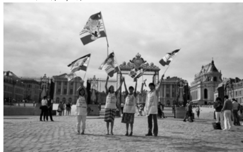
▲ 勇士們在法國皇宮前豎立萬民大旗，宣告君王必被牽引而來