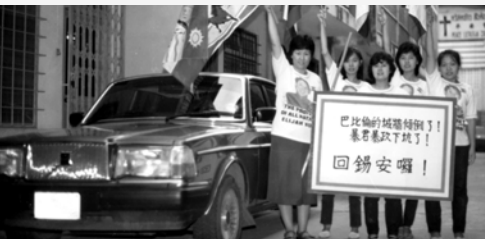
▲ 泰國支派盡末後以利亞的職事，向列邦萬國宣告神末世至高旨意