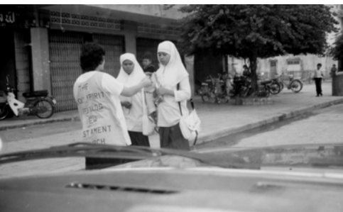
▲ 向回教學生傳福音