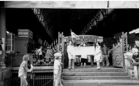
▲ 在西班牙市場宣告神末世至高旨意