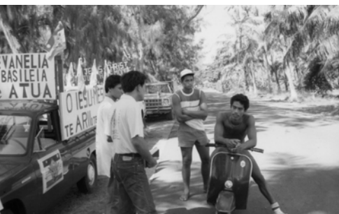
▲ 路人停車聆聽神國的福音