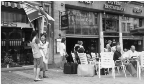
▲ 愛麗姊妹展揚大旗，並用英文宣告神旨，陶荷恩姊妹繙成法文