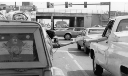
▲ 在前進途中有人從車窗口接福音海報