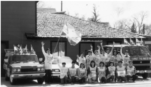
▲ 3月19日勇士們出征雷諾前，在雷諾教會的會所前合影