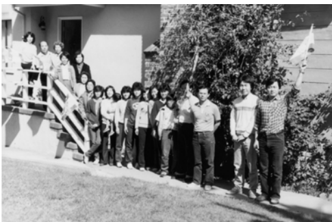
▲ 3月22日弟兄姊妹來到三藩市謝弟兄、謝姊妹的家