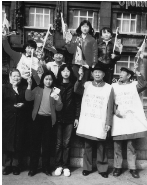
▲ 德國弟兄姊妹起來向日耳曼民族傳揚全備福音