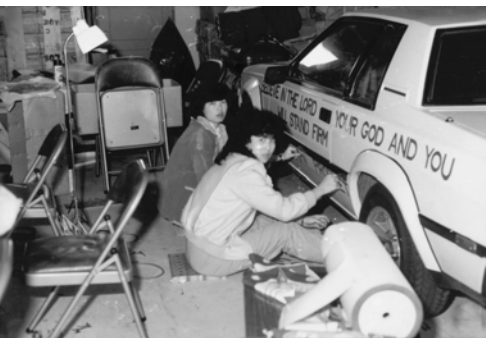
▲ 弟兄姊妹一同製作福音車的海報看板，並貼在福音戰車上