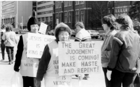
▲ 梁老姊妹、麟石弟兄高舉福音看板在市中心盡職事