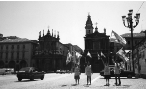
▲ 保羅所傳的福音，在義大利重新被宣告出來，這是真道得勝的明證