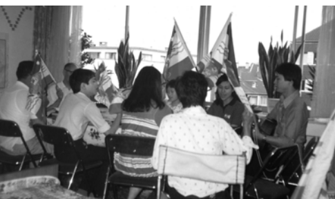
▲ 英、法、德的弟兄姊妹一同聚會