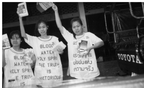
▲ 勇士們在雨中盡職事