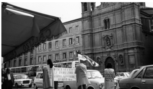
▲ 他們展開西班牙的海報，並用英語、西班牙語宣告神諭