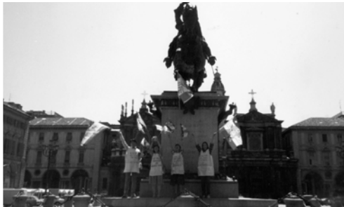
▲ 勇士們在此宣告，羅馬帝國的強權已成了歷史上的陳跡