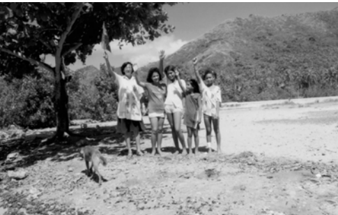
▲ 四位土著少女歡喜得知這福音