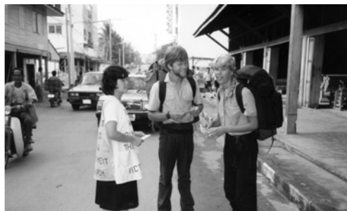
▲ 向雅弗後裔見證閃的神