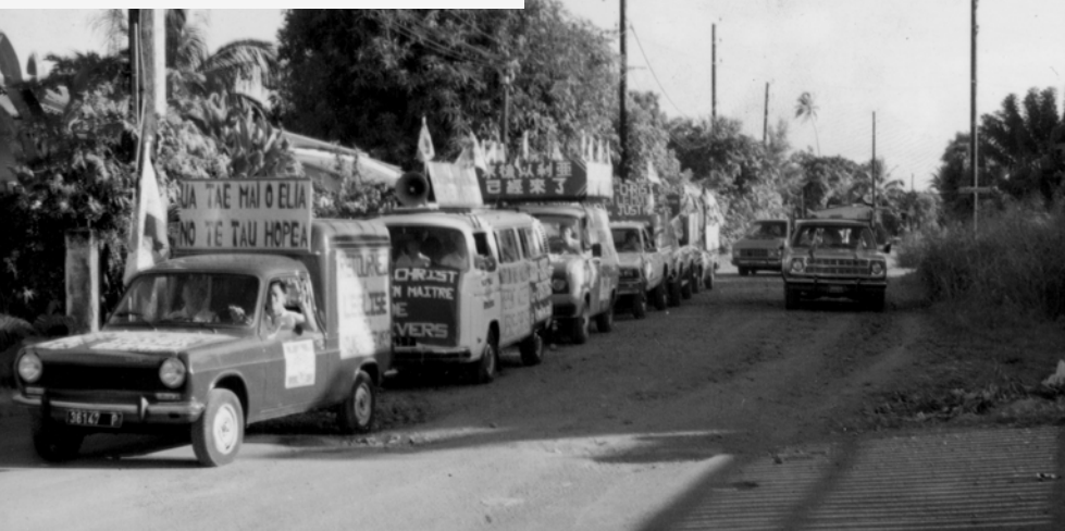
▲ 福音戰車隊由大溪地出發