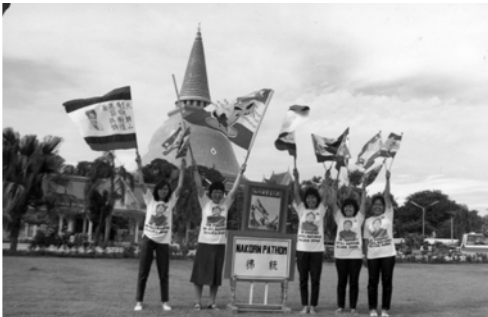
▲ 8月12日基督精兵奉差遣出征泰南，首先收復「佛統」歸「神統」