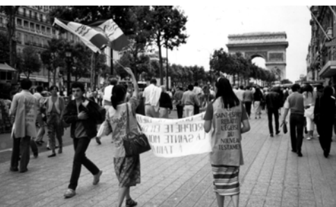
▲ 這凱旋門象徵著我們得勝強權凱歸錫安