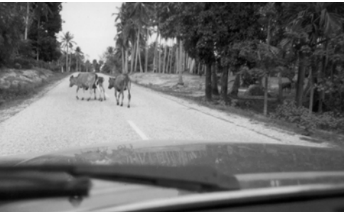
▲ 巴珊大力公牛在基督精兵面前逃之夭夭