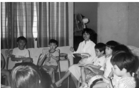
▲ 哥打京那峇魯教會弟兄姊妹一同歡唱詩歌——之一