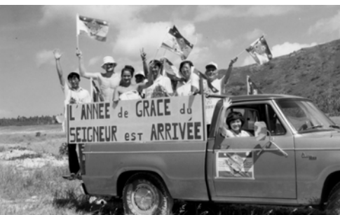
▲ 一對兄妹認罪後，坐上福音車去找有水的地方受水浸歸主名下