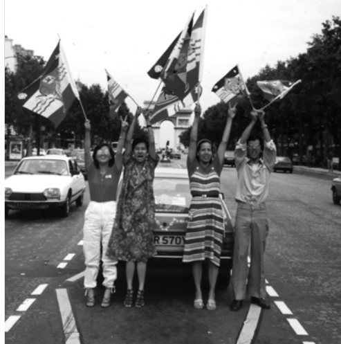
▲ 勇士們盡職事畢，宣告耶穌基督已收復歐洲失土，我們必得勝進入凱旋門，榮歸錫安