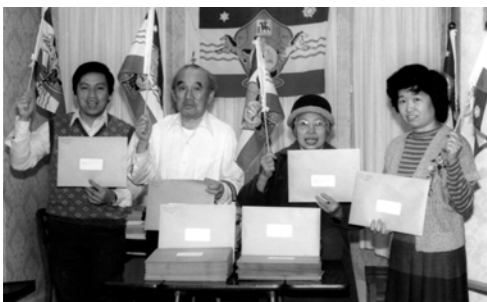
▲ 多倫多支派寄發信件及福音海報向地極的君王、臣宰、審判官作見證