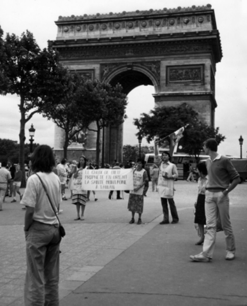
▲ 在巴黎凱旋門前，展開法文的海報，用英、法語大聲宣告神旨