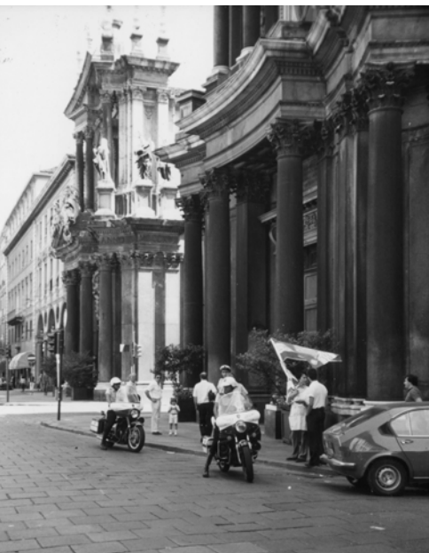
▲ 在義大利警察的攔阻下，勇士們大公無畏的高舉大旗，派發單張