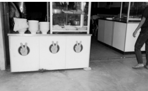
▲ 神又屢次讓他們看見「V」字形。一路得勝！處處得勝！