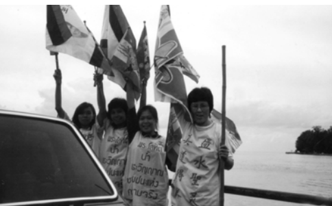
▲ 勇士們長途跋涉，宣告神旨。此張相片攝於渡輪上