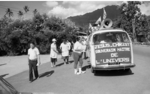
▲ 路人前來詢問真道且領受