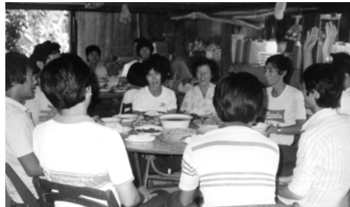
▲ 弟兄姊妹一同享受主愛的筵席