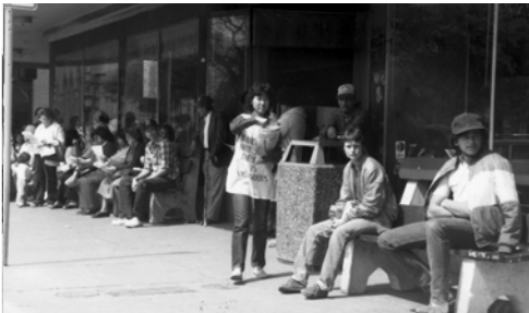
▲ 書芳姊妹在聖安東尼歐盡職事，百姓專心閱讀福音海報