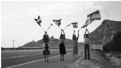
▲ 勇士們展揚萬民大旗，在靈裡扭斷巴珊大力公牛的頸項