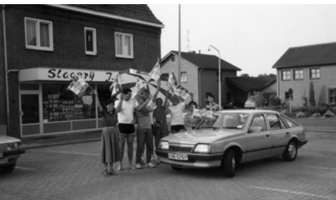
▲ 荷蘭人歡然前來，與弟兄姊妹一同高舉萬民大旗合照