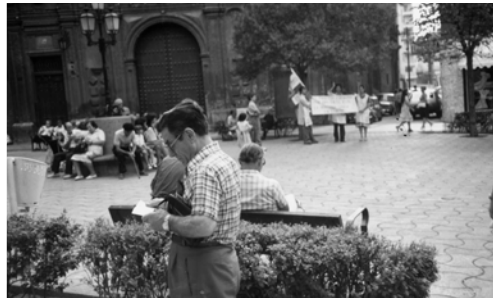
▲ 西班牙人渴慕真道，虛心閱讀福音單張