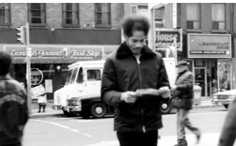
▲ 路人閱讀福音海報