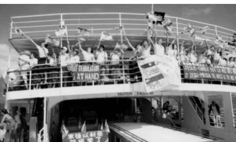
▲ 勇士們看見福音飛機飛來，高舉萬民大旗，揚聲招手