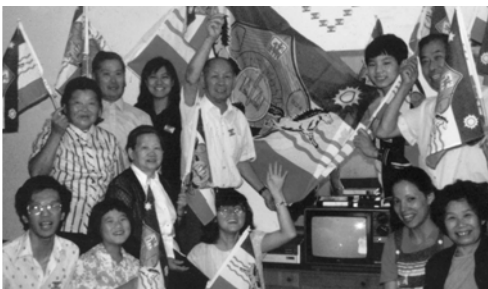
▲ 德國弟兄姊妹為主所預備的錄影機及閉路電視機，向神感恩