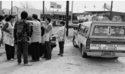
▲ 3月9日在聖安東尼歐整裝待發