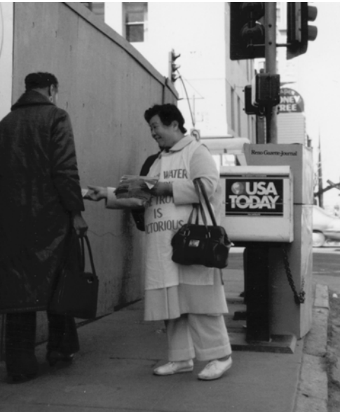
▲ 藍姊妹派發福音海報