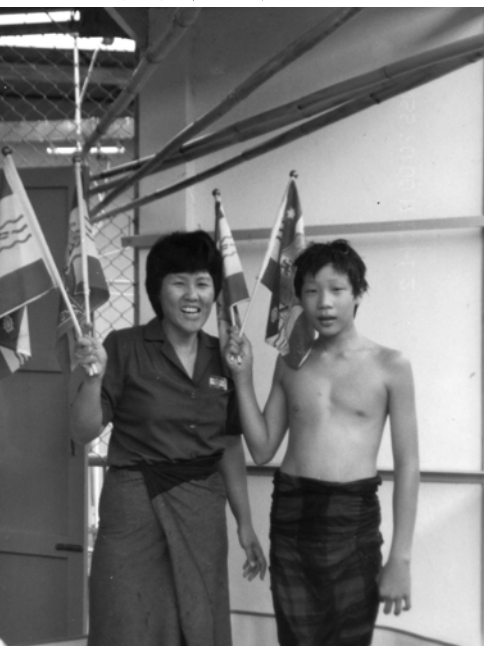
▲ 神將得救人數加給泰國的教會