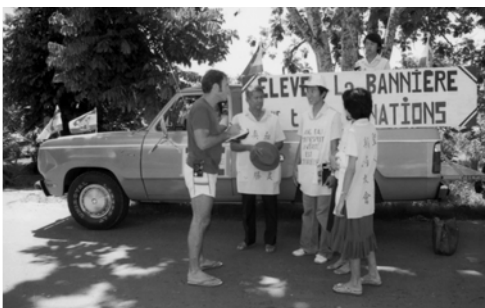
▲ 在盡職事之路上，新聞記者（左一）來訪