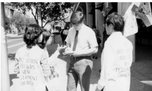
▲ 3月20日在加州首府沙克拉門度，一記者正在訪問基督精兵