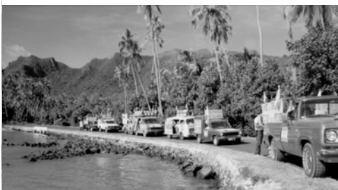
▲ 福音戰車圍繞摩利亞島至終點站