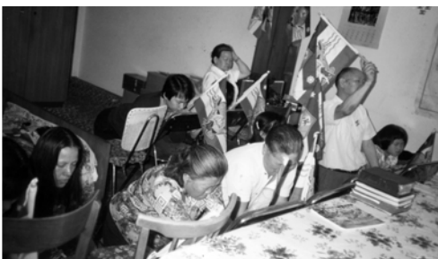
▲ 早禱會中，弟兄姊妹為著錫安的冤案迫切向神呼求