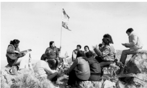
▲ 3月18日（主日）弟兄姊妹在淨光的高地豎立大旗，一同聚會