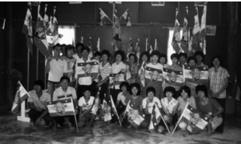
▲ 小蓮之家日漸興盛