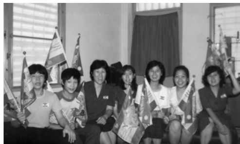
▲ 弟兄姊妹歡歡喜喜一同合照