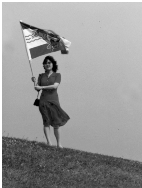
▲ 哈力費士的勇士揚起真理旗，招回被趕散的神子民