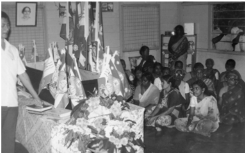
▲ 居林里珠蜜姊妹的母親的安息聚會