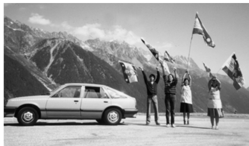
▲ 前往義大利，在白朗峰（阿爾卑斯山最高峰）豎立得勝大旗