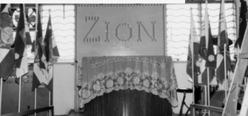
▲ 古晉教會新會所面貌一新