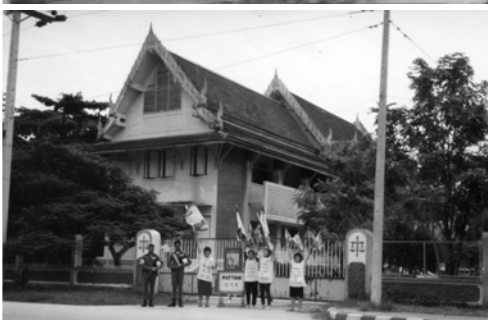
▲ 勇士們接著到叻丕、碧武里、巴屬、仁廊、普吉、攀牙、甲咪、董里、合艾吹角揚聲，拯救靈魂