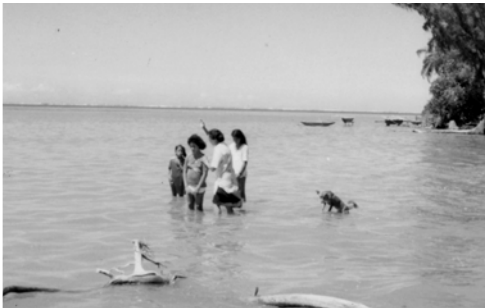
▲ 在海邊即刻受水浸歸主名下