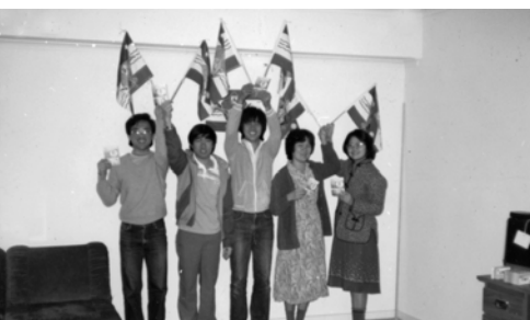
▲ 澳洲的弟兄姊妹在艱難中仍持定回錫安的異象，一同舉旗合影