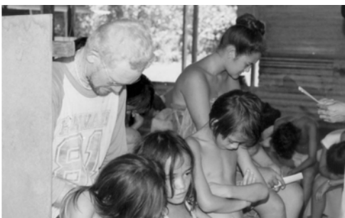
▲ 眾人領受這福音一同認罪悔改