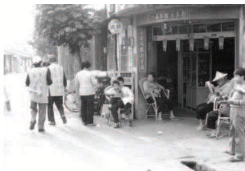
▲ 台灣的居民有福了！有天國的福音傳給他們