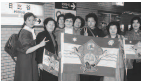
▲ 日比谷車站豎立大旗