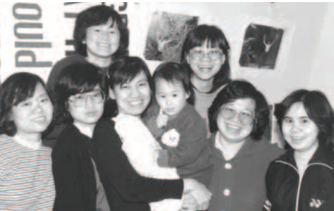
▲ 倫敦教會的姊妹們