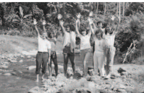
▲ 在溪流為人施水浸 (雷阿爹阿島)