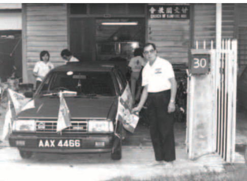
▲ 甘文閣支派準備出征