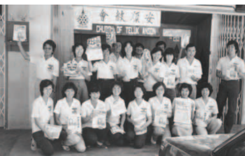
▲ 安順支派高舉福音海報，準備出征