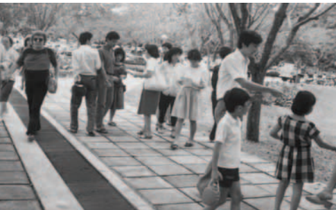
▲ 各方各族的百姓都得聽神國的福音