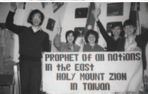
▲ 英國的弟兄姊妹一同努力製作福音車海報看板，準備作戰