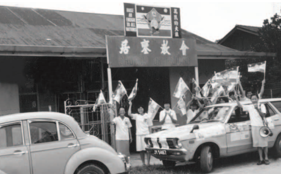
▲ 基督精兵開屬靈戰車，舉旗向居鑾的戰場前進