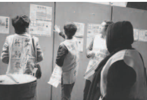
▲ 把福音海報張貼在港九各處