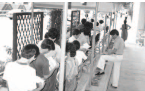
▲ 候車的人都在閱讀福音海報