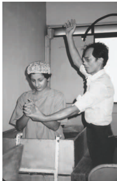
▲ 神把含齋帶回吉隆坡教會，印度籍的姊妹受浸歸主名下