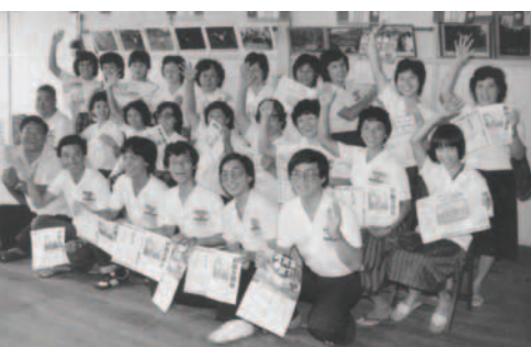
▲ 民那丹支派歡歡喜喜一同盡職事