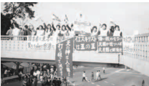
▲ 勇士們在原宿的天橋上豎立萬民大旗，張掛看板