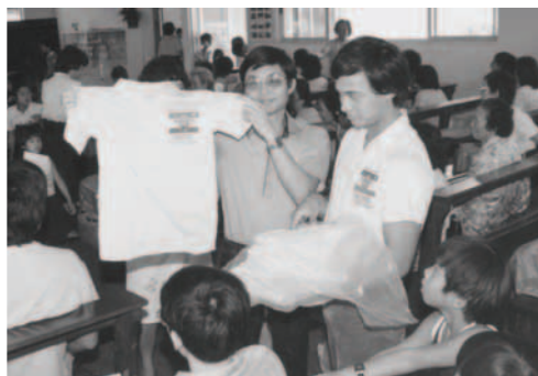
▲ 由基督靈恩佈道團寄出的印有「萬民大旗」及「一人一山」圖案的T恤，半年後才抵大溪地，弟兄姊妹歡喜領受神恩