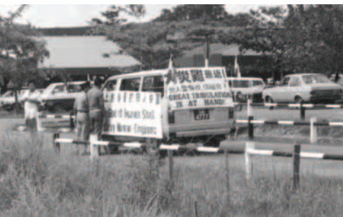
▲ 福音戰車來到通往西連的關卡