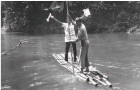
▲ 渡約但河進攻迦南