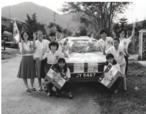
▲ 福音的腳蹤遠達各鄉各城