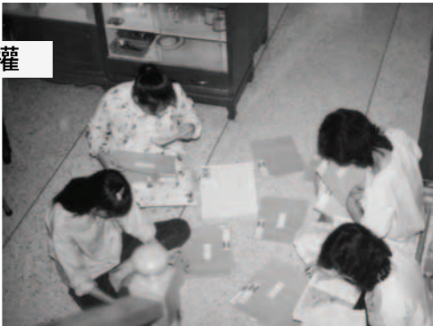
▲ 泰國見證人受感向列王寄發福音海報，姊妹們正在信封上貼上執政掌權者的地址