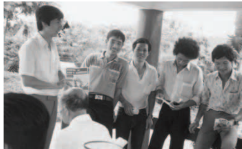
▲ 遠自澳門來的百姓歡喜聆聽神國的福音