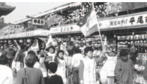
▲ 勇士們列隊出征淺草，舉旗打碎偶像的權勢