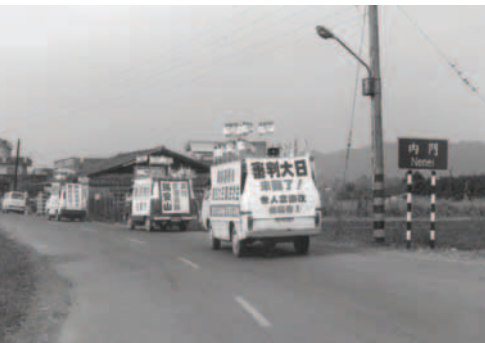
▲ 屏東、甲仙支派進軍六龜