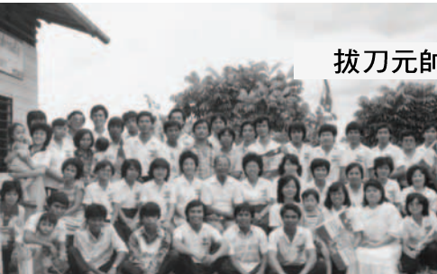
▲ 磐角支派準備出征西連戰役