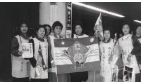
▲ 東京車站豎立大旗