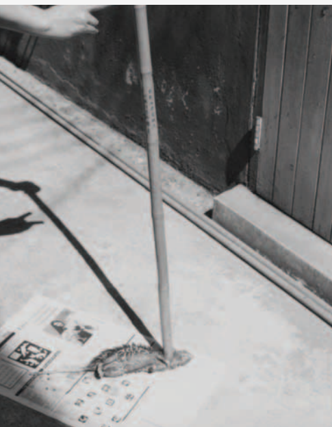
▲ 泰國見證人用神的杖對付鼠輩