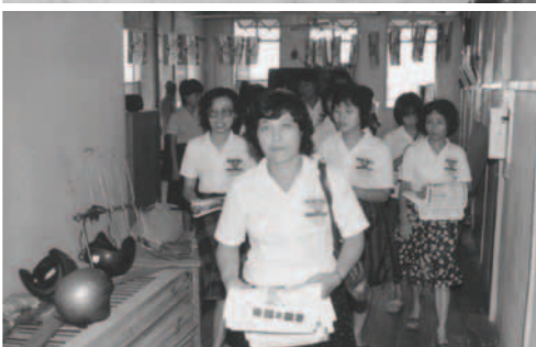
▲ 勇士們向民那丹戰場前進