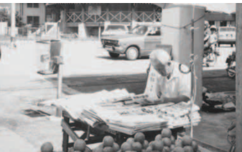
▲ 賣報的人專心看福音海報