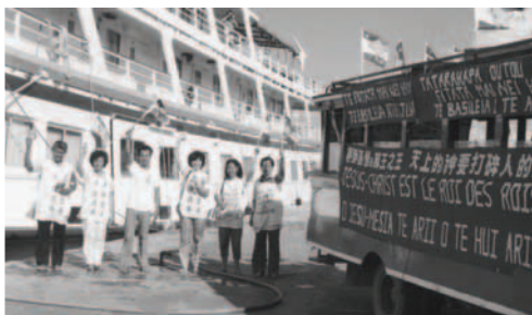
▲ 在港口盡職事，來自美國豪華大客船旅客得聽神國的福音 (雷阿爹阿島)