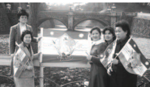
▲ 基督精兵表演歷史性的一幕，他們在代表整個日本統治權的二重橋前及皇宮前，豎立起耶西的根萬民大旗，對管轄大和民族的統治者宣告：你的國度已被打碎！耶穌基督要在日本作王掌權！