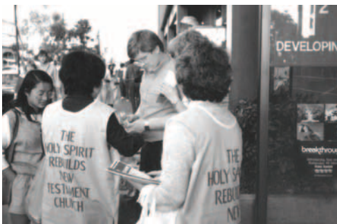
▲ 美國三藩市基督精兵傳揚神主權的福音，挪威來的一對夫婦得知神國的福音