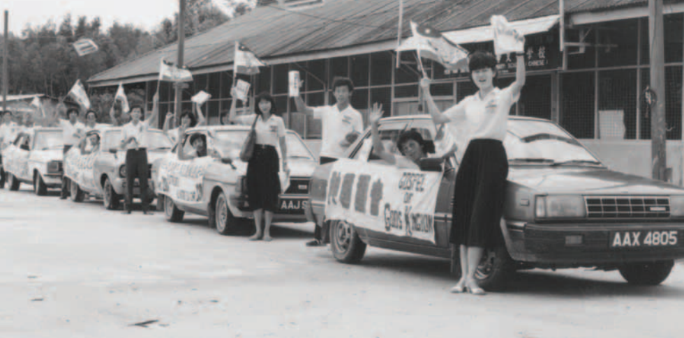
▲ 怡保支派基督精兵來到一所學校，傳揚神主權的福音