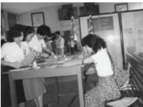
▲ 姊妹們在郵局內貼郵票