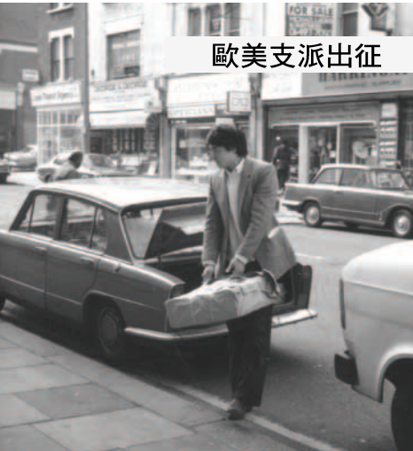
▲ 基督靈恩佈道團由台灣運六百多公斤的福音海報抵達英國