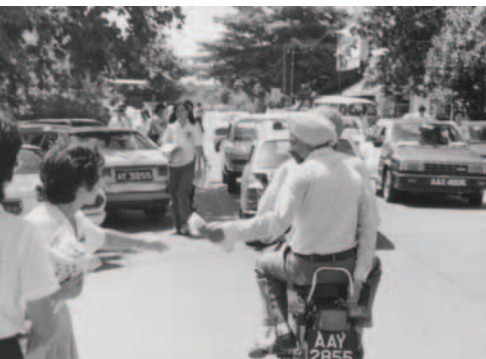
▲ 希克人伸手要福音海報