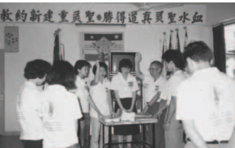
▲ 星洲支派奉主的名，準備出征