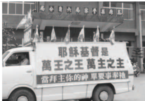
▲ 基督精兵向內門戰場前進