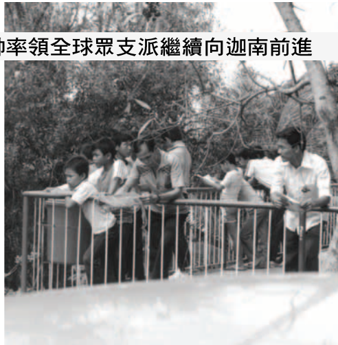
▲ 磐角支派傳福音，接到福音海報的人都被吸引、專心閱讀