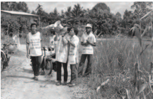
▲ 弟兄姊妹用土語向沙安喜布蘭村的居民宣告神國的福音

▲ 磐角支派弟兄姊妹來到偏遠的村落，傳揚神主權的福音。基督精兵舉旗前進之時，出現彩虹圍日的天象，弟兄姊妹舉旗歡呼