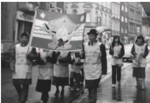
▲ 德國百姓有福了！有神國的福音傳給他們