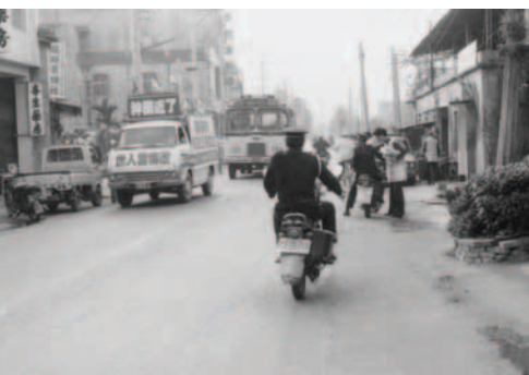
▲ 弟兄姊妹傳福音常遇警察跟蹤、盤詢