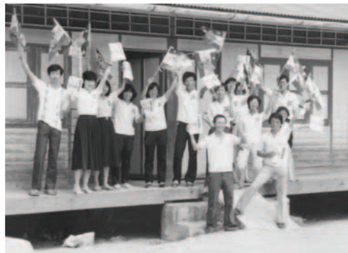
▲ 基督精兵向仇敵進攻