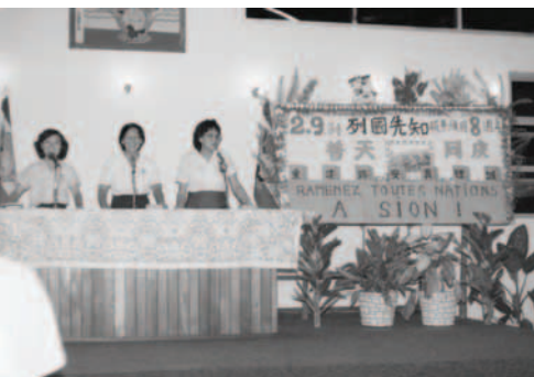
▲ 2月9日，芝英姊妹交通八年前神顯明主僕洪弟兄承接神使女江姊妹的職事