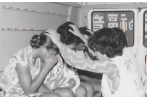
▲ 土著紛紛領受聖靈浸 (他哈島)