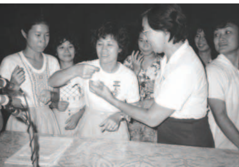
▲ 元月30日神為大溪地支派預備了百香果，弟兄姊妹彷彿如看到錫安山土產般，非常喜樂