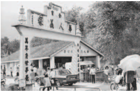
▲ 怡保支派出征金寶