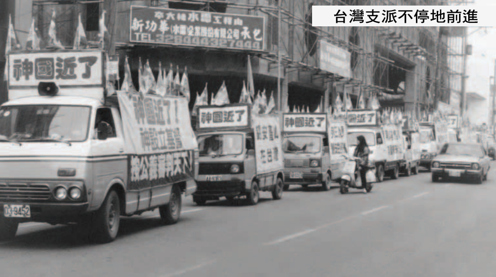
▲ 基督精兵一同進軍桃園