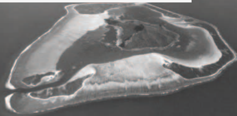
▲ 毛必第島全景鳥瞰