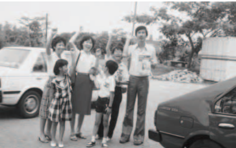
▲ 基督精兵奉主名收回兀蘭，歸萬王之王我主耶穌基督