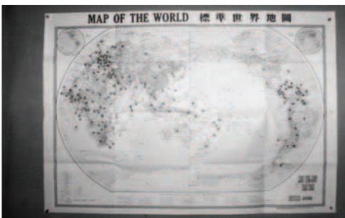
▲ 圖中黑點所示為已寄發福音海報的各國