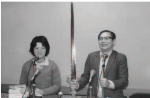
▲ 主藉瑛杰弟兄1981年送來的王者之劍沒有劍鞘一事，如今主僕洪弟兄突蒙神開啟，原來是拔刀元帥的刀早已出鞘了