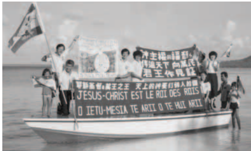
▲ 勇士們駕駛福音登陸艇向附近島嶼前進