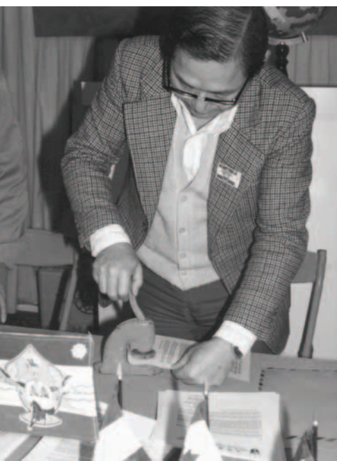
▲ 主僕洪弟兄在給列王的信上蓋上基督靈恩佈道團的鋼印