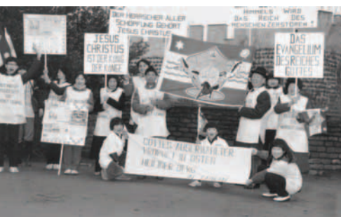
▲ 德國科隆的弟兄姊妹高舉萬民大旗、福音看板盡以利亞的職事