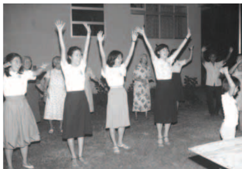
▲ 弟兄姊妹為著神興起屬靈的首領，向神歡呼、跳舞讚美神