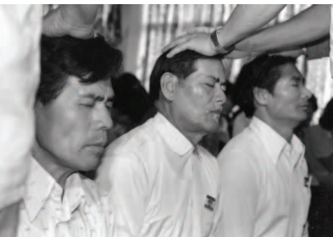
▲ 主僕們為三位受苦的見證人按手禱告