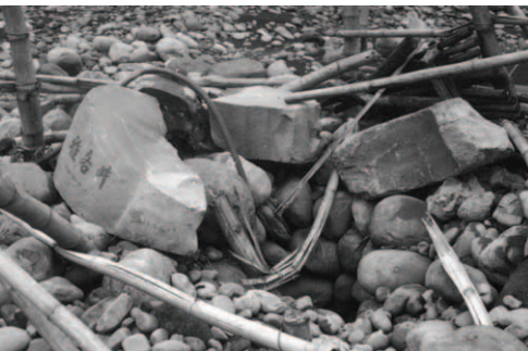
▲ 怪手把羔羊同伴們賴以為生的雅各井搗毀，且填滿石頭