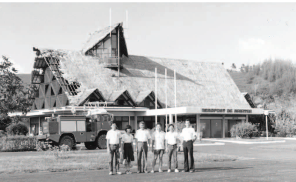
▲ 基督精兵在泥雨爹島盡完職事，返回大溪地前在機場合影