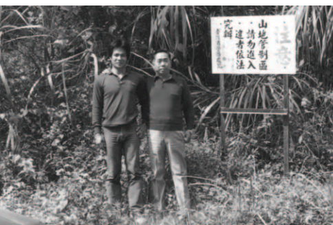
▲ 錫安山腳下赫然出現一塊以前沒有的「山地管制區」字牌