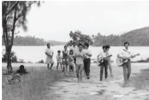
▲ 弟兄姊妹喜樂地彈吉他，唱著詩歌，由海邊走回家