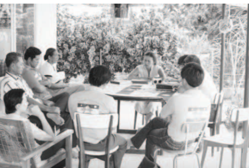
▲ 毛必帝島的弟兄姊妹