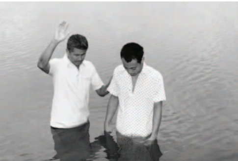
▲ 陳元弟兄的兒子亞先弟兄領受全備真道，受浸歸主名下