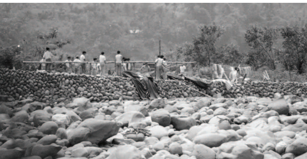
▲ 帳棚夷平後，又來了大隊警察，把談劉三家僅賴以蓋行李的雨布全數掀開