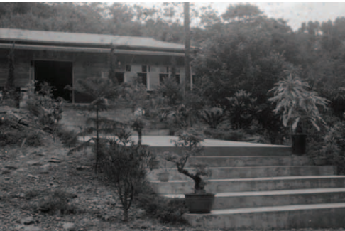
▲ 昔日大會所、所羅門階梯的雄姿