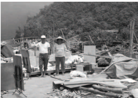
▲ 談弟兄、談姊妹的物品暴露在烈日之下