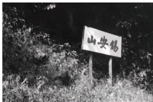
▲ 原先所插的「錫安山」牌子已不見了