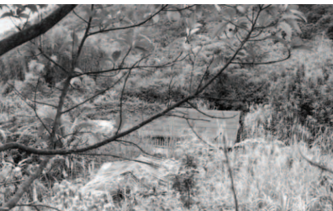
▲ 談弟兄家盡被野草包圍