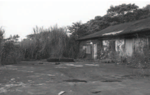
▲ 姊妹宿舍破損不堪