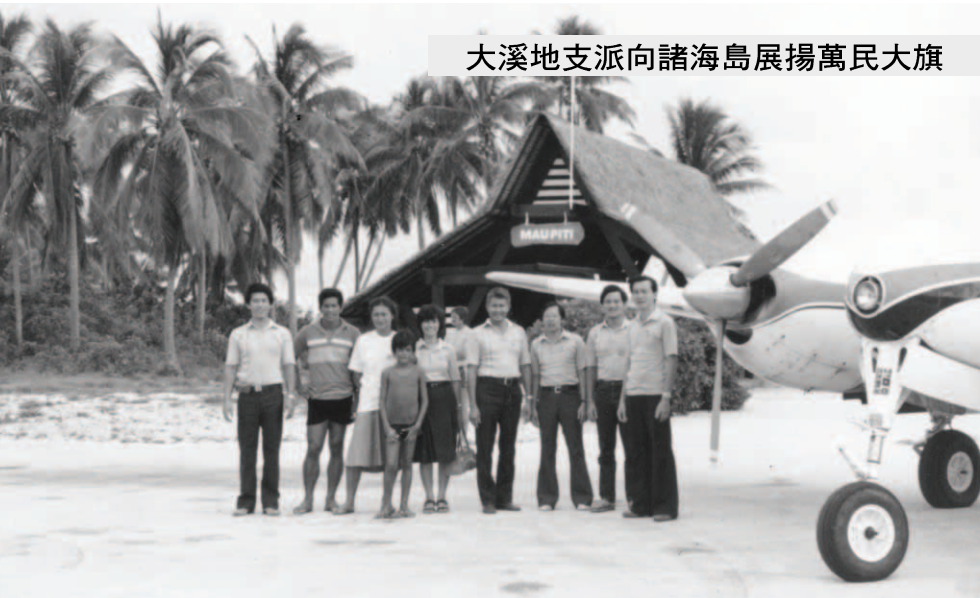
▲ 大溪地支派耶和華的軍隊往附近諸海島盡末後以利亞職事