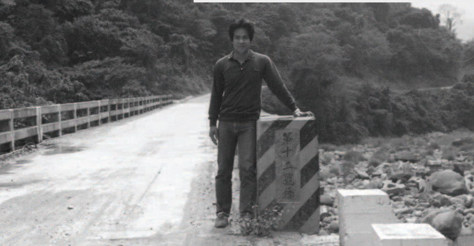
▲ 首先來到錫安山腳下的十二號橋