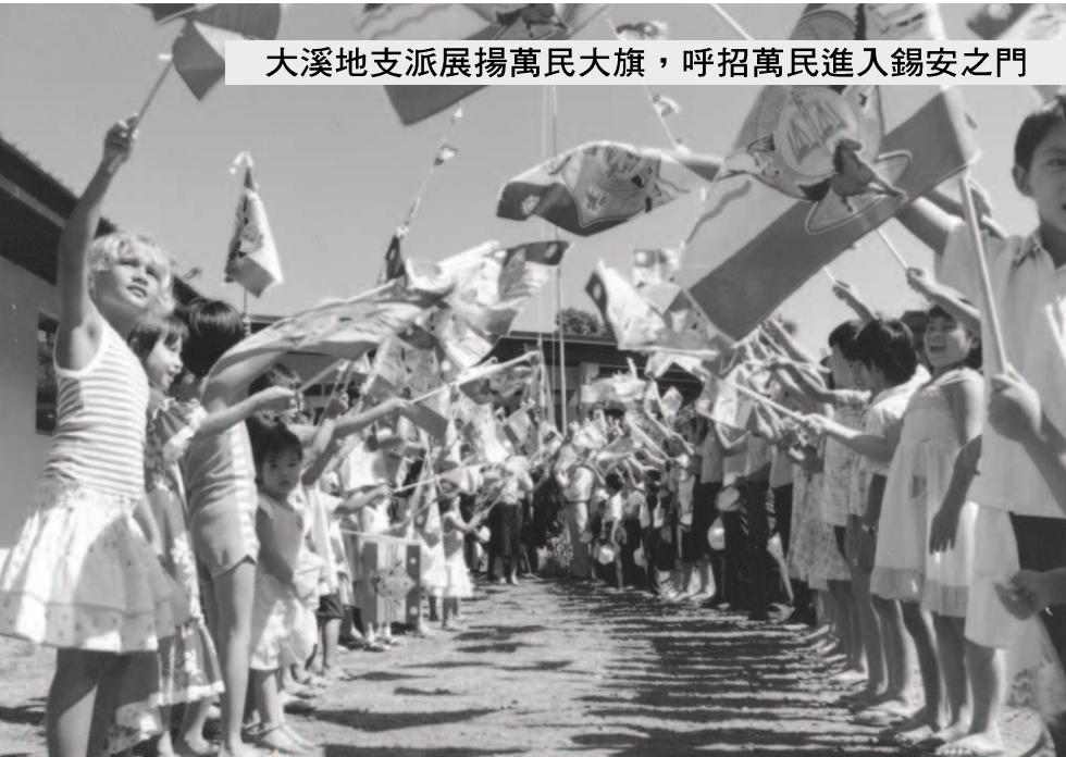
大溪地支派展揚萬民大旗，呼招萬民進入錫安之門