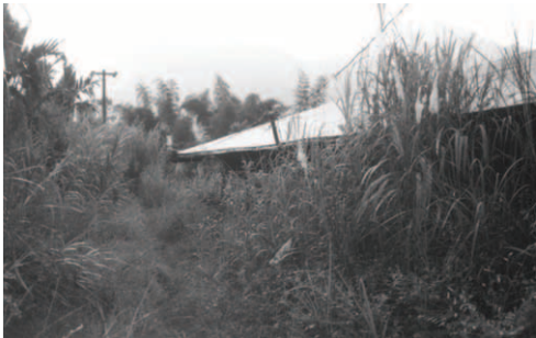
▲ 弟兄宿舍雜草高過屋頂