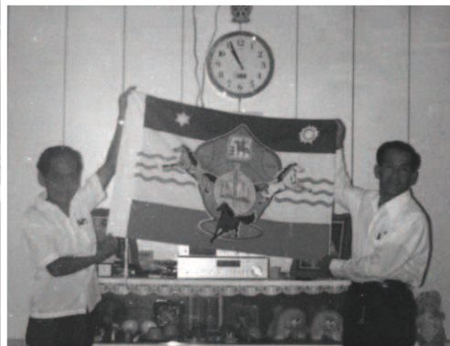
▲ 一月廿四日印尼弟兄姊妹在境內豎立萬民大旗，見證：耶西的根已立作印尼萬民的大旗