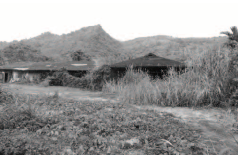
▲ 阿珥楠禾場已被荒煙蔓草吞沒