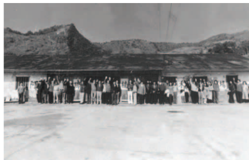
▲ 昔日阿珥楠禾場盛況