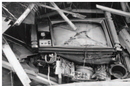
▲ 被怪手砸破的電視機