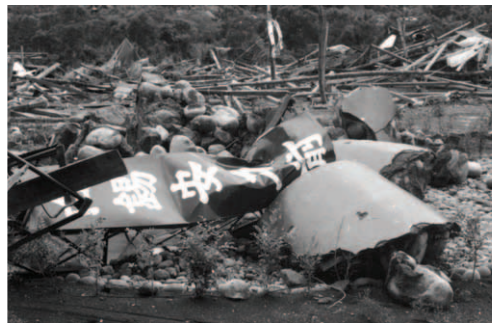
▲ 被怪手搗毀的「出埃及號」煙囪