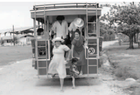
▲ 弟兄姊妹搭公車到各處傳揚天國的福音