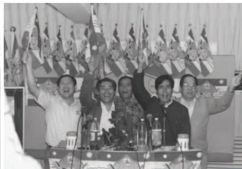
▲ 三位受苦見證人入監前夕看到錫安土產，充滿得勝歡呼