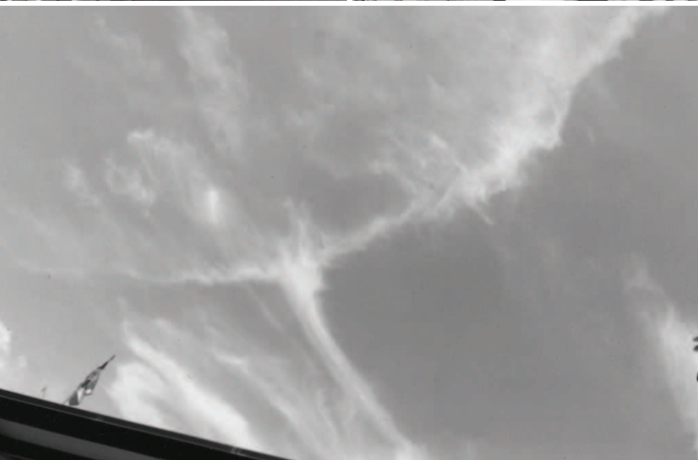
▲ 大溪地的天空出現「人」字形的雲彩，顯示大洋洲的百姓也要跟隨這一個人一同回到錫安