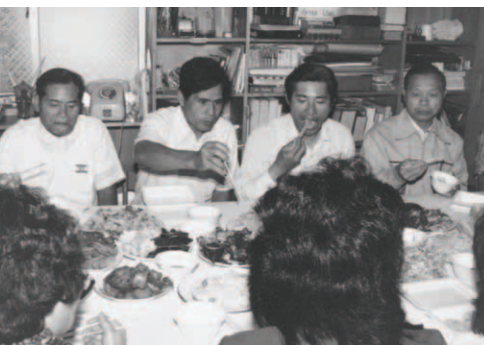
▲ 南部眾支派一同擺上頗有屬靈象徵的菜肴，海內外眾支派在與三位見證人一同下監的榮耀靈裡，參加這愛的筵席