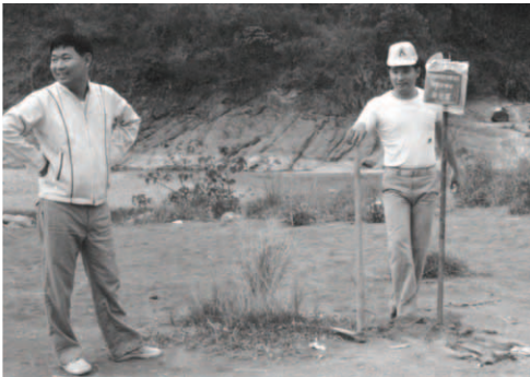
▲ 警方特特在河灘設置巡邏箱監視錫安子民