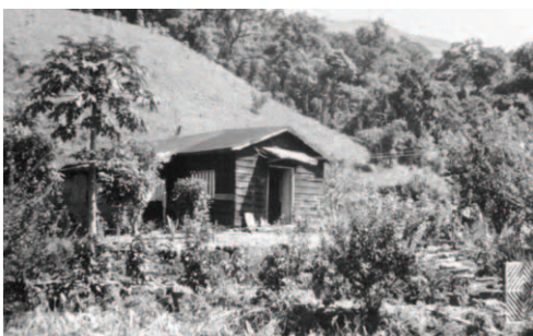
▲ 昔日談弟兄幽雅的家園