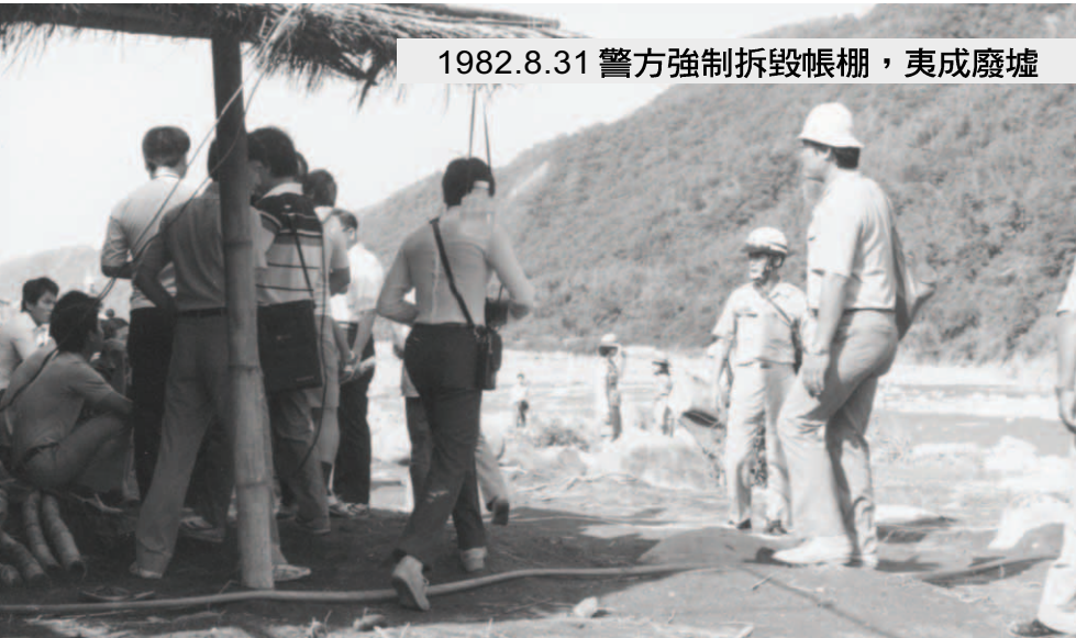
▲ 穿制服、著便衣的男女情治人員，身上背著對講機、錄影機……全然是有備而來