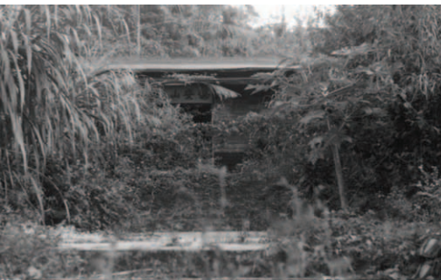
▲ 大會所已遭蔓藤雜草遮蔽