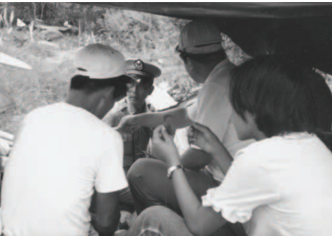
▲ 警方第三次強制問口供作筆錄