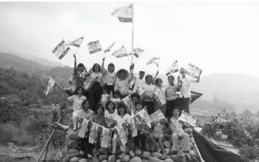
▲ 在小林河灘帳棚廢墟處，「出埃及號」得勝的見證又豐滿出現了！