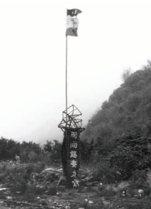
▲ 「面向錫安力前」的煙囪已不成形