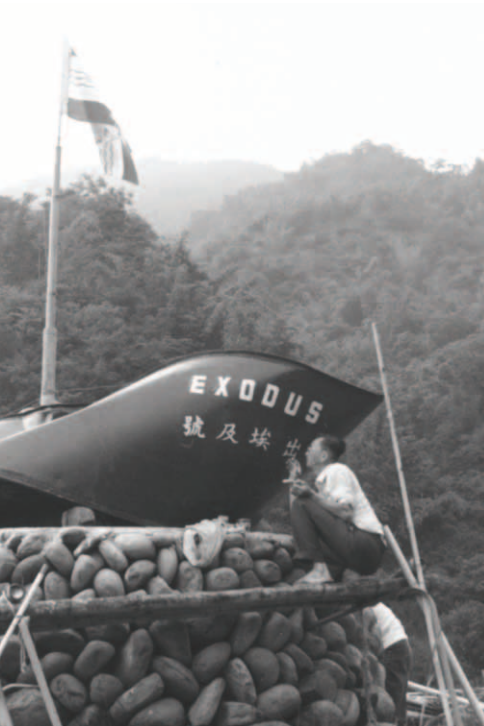
▲ 重新漆上「出埃及號」的字