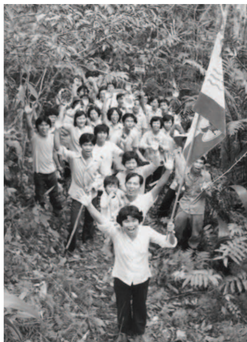
▲ 神使女殊賢姊妹高舉萬民大旗，帶領今日大衛的勇士們進到樹林，象徵到山寨投奔今日的大衛，得新地為業