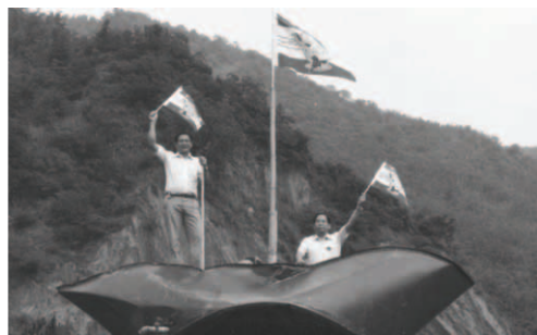
▲ 主僕洪弟兄、畢弟兄上到「出埃及號」舉旗歡呼