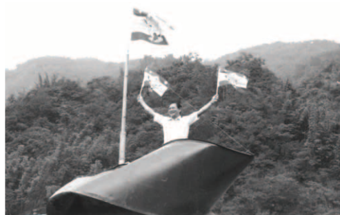
▲ 主僕洪弟兄宣告：「出埃及號」仍向錫安力前，必很快航向錫安