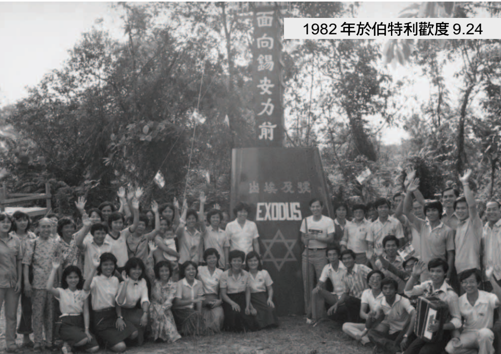
▲ 9.24~9.26婆羅洲特會，各地兄姊上到伯特利，在「出埃及號」煙囪前合影