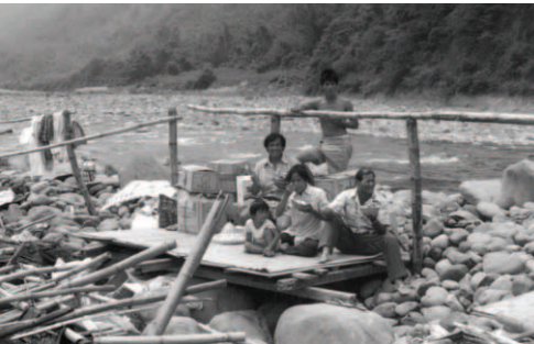
▲ 甫遭拆毀的河灘廢墟