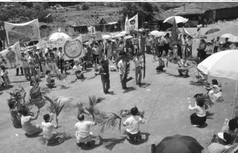
▲ 海内外眾支派獻上敬拜