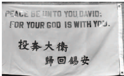
▲ 高雄支派 ▼ 美洲紐約支派