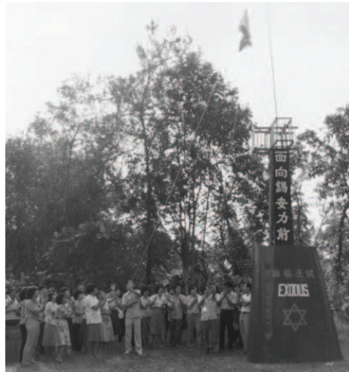
▲ 「出埃及號」豎立萬民大旗