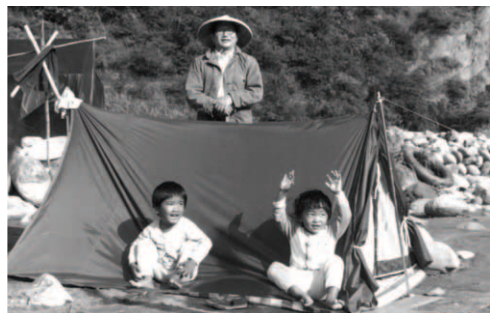
▲ 暫居的竹棚和帳棚