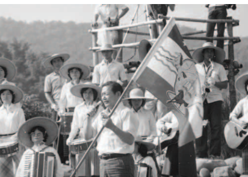
▲ 神僕人洪弟兄禱告