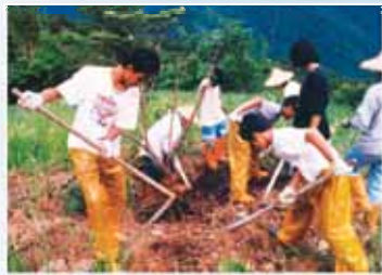
走出文明、回歸伊甸「作農夫」