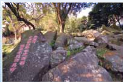
自然天成的小石頭山