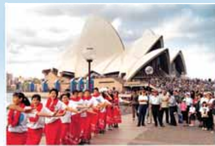
伊甸家園孩子在世界各地歌唱讚美傳福音