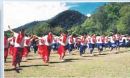
全球各支派上錫安朝聖 載歌載舞讚美神