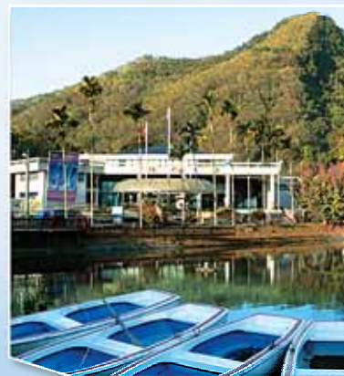
記念神使新約教會全得勝 大得勝的勝利大樓