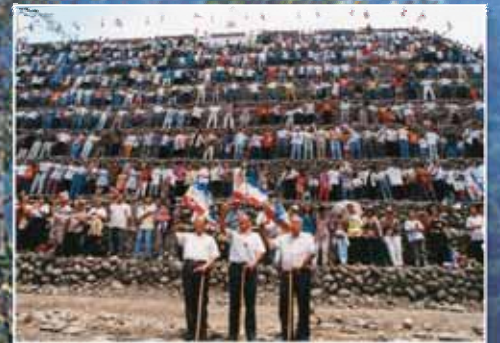
整體合一的新約教會立在錫安保障上