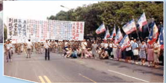
上街頭伸張正義，伐暴救人