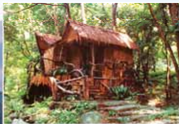
回歸伊甸的曙光樹屋