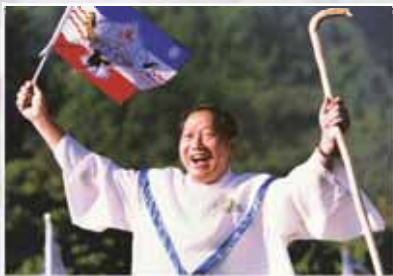
列國先知洪以利亞帶領全球聖徒擺出朝聖行列