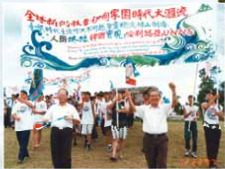
全球伊甸家園大匯流

伊甸家園的孩子感念神恩，陸續編成五百多首歌舞，表達靈裡的自由、喜樂與釋放。這些歌舞，曾在澳洲向成千上萬的各國人士見證了神榮耀的救恩；也曾在以色列的國宴中大放異彩，吸引了各國使節及中外名流。錫安山伊甸家園的孩子每逢假日，也常藉著歌舞來宣揚主的救恩。（詳情請參閱「伊甸家園時代主流」簡介，或至勝利大樓一覽伊甸家園感恩展）