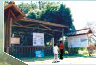
四館在守望樓舊址