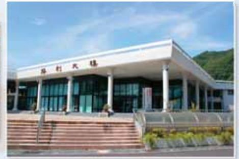
總館在勝利大樓一樓