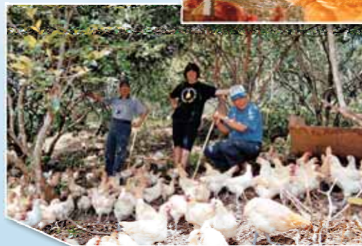
放山雞與苦茶樹共生共榮的伊甸境界