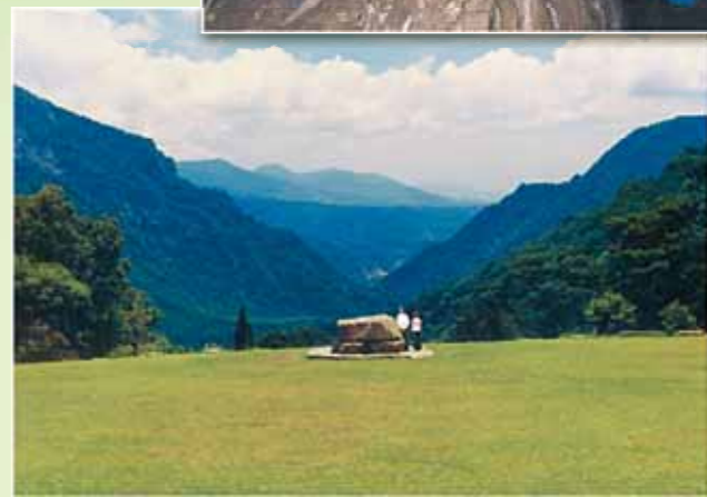
從聖殿南望祭壇，千山萬嶺氣勢宏偉