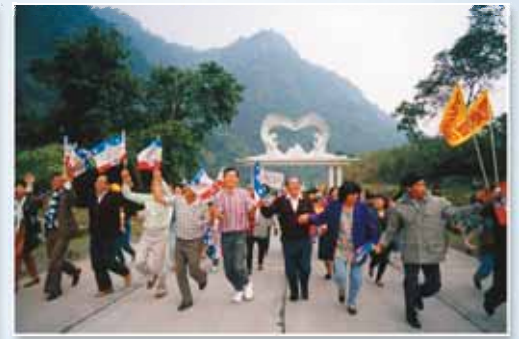
基路伯大門—生命樹的道路暢通了