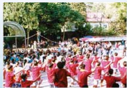
勝利大樓廣場上的讚美