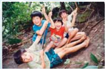
在大自然中得著自由與釋放