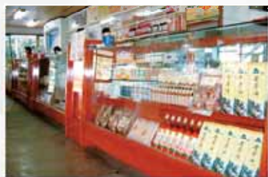
凱旋樓供應各種無毒有機產品