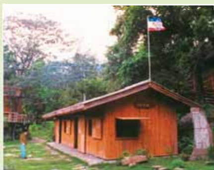
閃、含、雅福的後裔要住進「閃的帳棚」