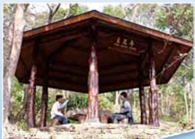
立君亭 神說：「我已經立我的君在錫安我的聖山上了！」