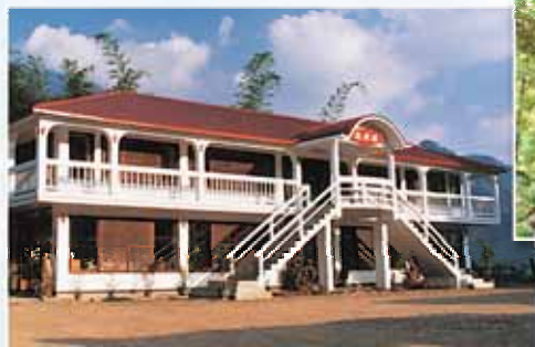
紀念七年血戰得勝暴君暴政的凱旋樓

錫安大君王——耶穌基督，揀選列國先知洪以利亞代表神執掌王權，為要藉著他在列國中設立神的公理，施行神的救恩，這正是舊約時代大衛王在錫安保障盡職事所預表的。錫安子民於天池前方蓋造三幢典雅的原木屋，題名為「大衛城堡」。即見證神所揀選的今日大衛必按神旨，在錫安建立基督的國度。