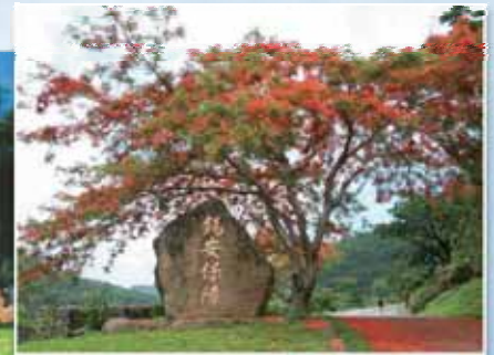
錫安保障頂端的城垛