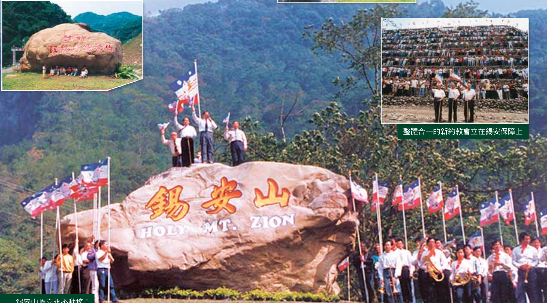
錫安山屹立永不動搖！