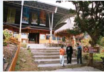
二館在昔日錫安大會所舊址