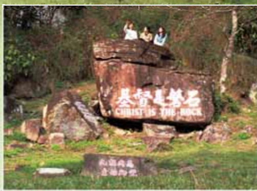
聖殿東邊的大磐石