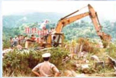
警察以怪手夷平雨布帳棚