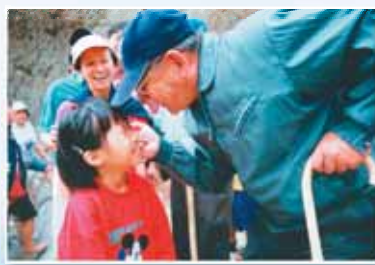
先知慈愛地捏孩子們的臉頰