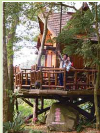
伊甸風味的錫安樹屋